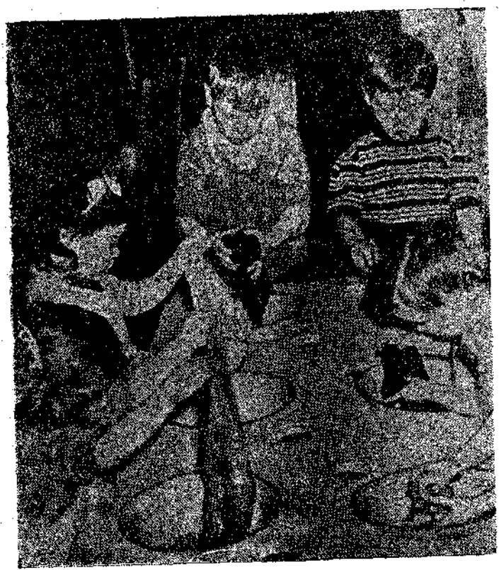
Σε μια παιδική στήνη στην 'Αγγλία οι μικροί τρώφιοι κλέβουν μόνοι τους τα ρούχα τους. Και τί σαβαρό που κάνουν τη δουλειά τους!

β.δλλο με τον τίτλο : «Οι μυστικές ί.ροτελεστίες των Ιερέων του AMEN-PA».