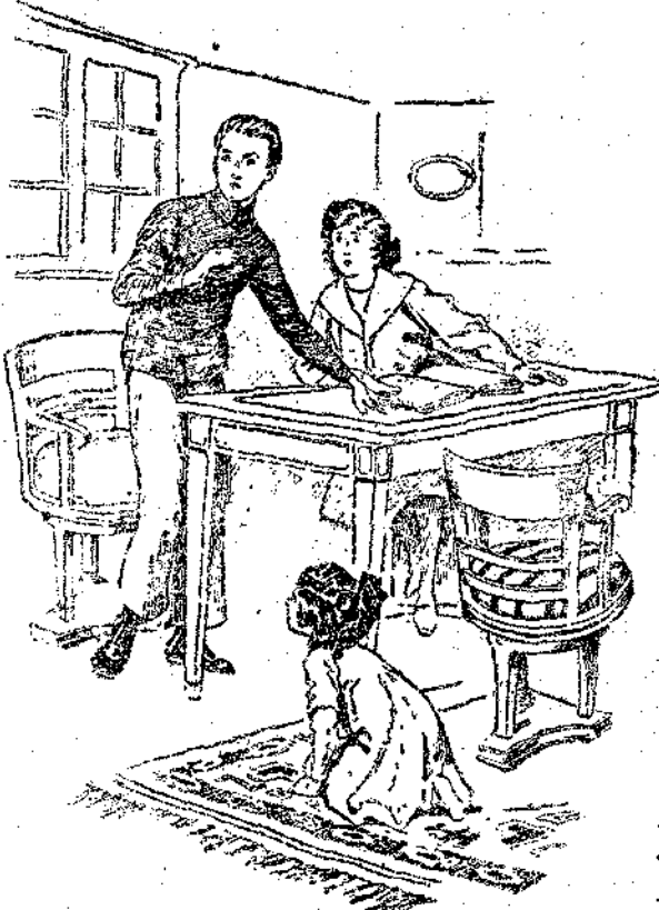
Εσκόψε τὸ βιβλίό του και σηκώθηκε