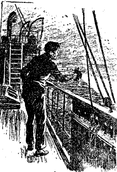
Έριξε τό φώς σέ πολλές διευθύνσεις... (Σελ. 182 στ. α')

Γιά δεύτερη φορά γύρισε τό φανάρι του παντός μά δέν είδε τίποτα. Τά μάτια του πέσανε στα φύκια. Και τότε τού φάνηκε πώς όλο αυτό τό άγριο βασίλειο τής έρημιάς και