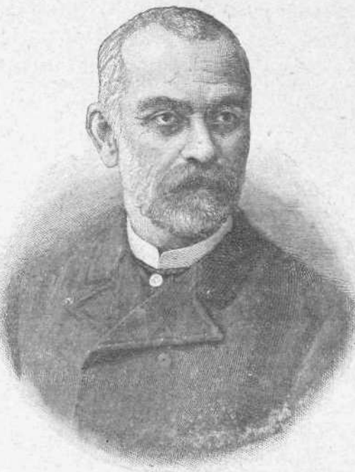
Ἄγγελος Βλάχος Ὁ νέος ἐπὶ τῆς Παιδείας Ὑπουργός

ὁποίας τόσοσιν δεικνύει ἀκόμη ἐνδιαφέρον. Ἄλλως τε ἐν περιοδικόν, ἐπὶ πολλὰ ἔτη ζῆσαν, δὲν διαφέρει πολὺ ἀπὸ ἑνα οἶκον ἀρχαίων. Οἱ νέοι διαδέχονται τοὺς παλαιούς· ἡ νέα ζωὴ εἶνε ἡ ἀμείωτος συνέχεια τῆς παλαιᾶς· καὶ ἂν μεταβάλλωνται τὰ πρόσωπα,