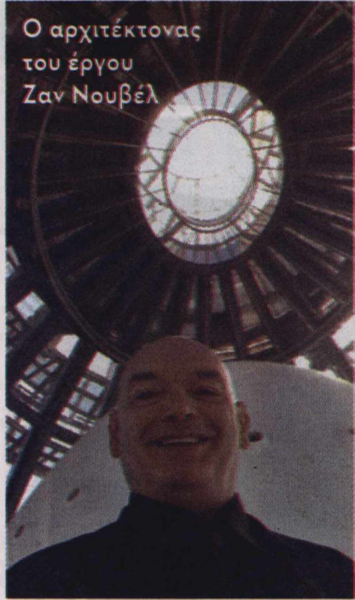
Ο αρχιτέκτονας του έργου Ζαν Νουβέλ