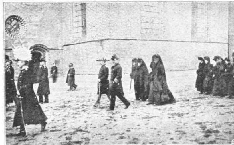
Ο ΒΑΣΙΛΕΥΣ ΦΡΕΙΔΕΡΙΚΟΣ ΜΕΤΑ ΤΩΝ ΑΔΕΛΦΩΝ ΤΟΥ ΠΑΡΑΚΟΛΟΥΘΩΝ ΤΗΝ ΚΗΔΕΙΑΝ