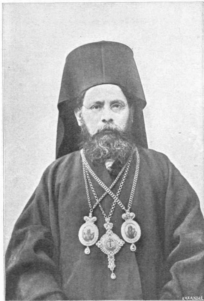
Ο ΠΑΤΡΙΑΡΧΗΣ ΑΛΕΞΑΝΔΡΕΙΑΣ ΦΩΤΙΟΣ

Έγεννήθη τόν Νοέμβριον του 1853 εν Πέρα της Κων/πόλεως.