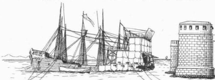
ΣΧΕΔ. 26. Ἐφαρμογὴ τῆς Ἐλεπόλεως εἰς προσβολὴν φρουρίων ἀπὸ τοῦ πελάγους.

Καὶ κατὰ τὰ παράλια δ' ἐκράτουν παρακλήσια, ἅτινα δὴ συνάγεται ἐκ πλείστων τεκμηρίων ὅτι στερεοτύπως σχεδὸν ἐφηρμόζοντο καὶ ἐν ταῖς μᾶλλον ἀφραστάσις τῆς Μητροπό-