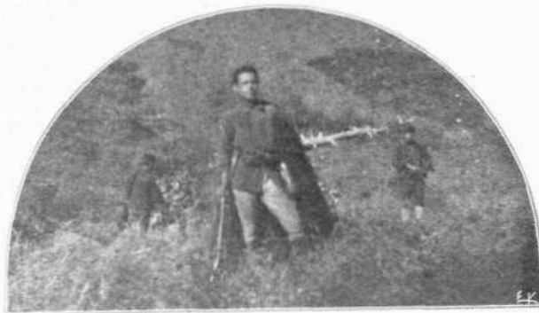
Ἐνα παραοῦλι τῶν προμίζων τῆς Μακεδονίας.