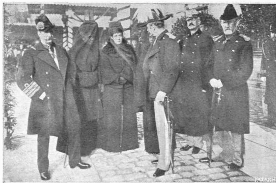
Ο ΝΕΟΣ ΒΑΣΙΛΕΥΣ ΤΗΣ ΔΑΝΙΑΣ ΜΕΤΑ ΤΩΝ ΑΔΕΛΦΩΝ ΤΟΥ ΕΙΣ ΤΟΝ ΣΤΑΘΜΟΝ ΡΟΣΚΙΑΔ

[Παρά τὴν νεκρικήν κλίνην τοῦ Βασιλέως Χριστιανοῦ συνενετρώθησαν ἀμέσως τὰ τέκνα του. Ἐκ τῶν πρώτων ἔσπευσεν ὁ ἡμέτερος Ἄναξ, ὅστις μάλιστα ἀνεκηρύχθη ὑπὸ τῶν ἀδελφῶν Του ἀρχηγὸς τῆς οἰκογενείας, ἡ Βασίλισσα τῆς Ἀγγλίας Ἀλεξάνδρα, ἡ χήρα αὐτοκράτειρα τῆς Ρωσίας Μαρία καὶ ἡ Δούκισσα τῆς Κομβερλάνδης μετὰ τοῦ συζύγου της.]