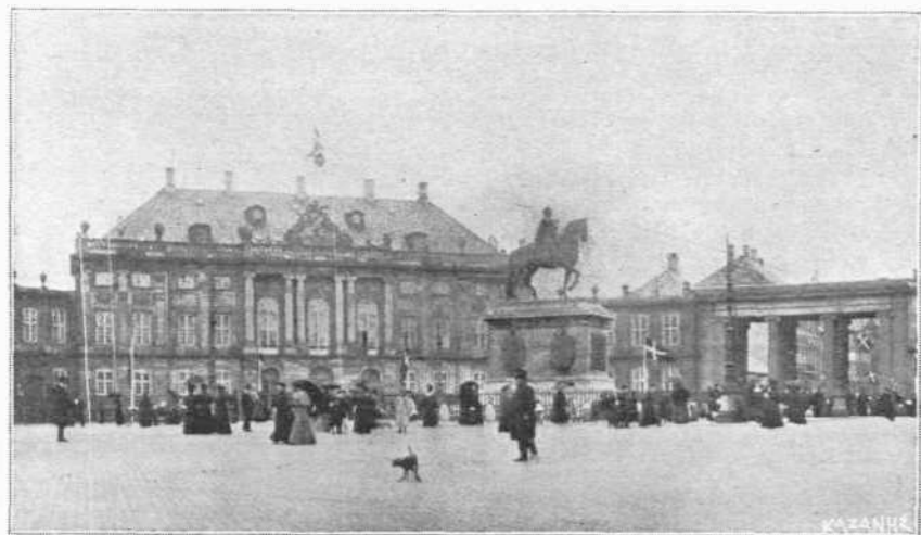
ΤΟ ΑΝΑΚΤΟΡΟΝ ΑΜΑΛΙΕΜΠΟΡΓ ΕΝΘΑ ΑΠΕΘΑΝΕΝ Ο ΒΑΣΙΛΕΥΣ ΧΡΙΣΤΙΑΝΟΣ