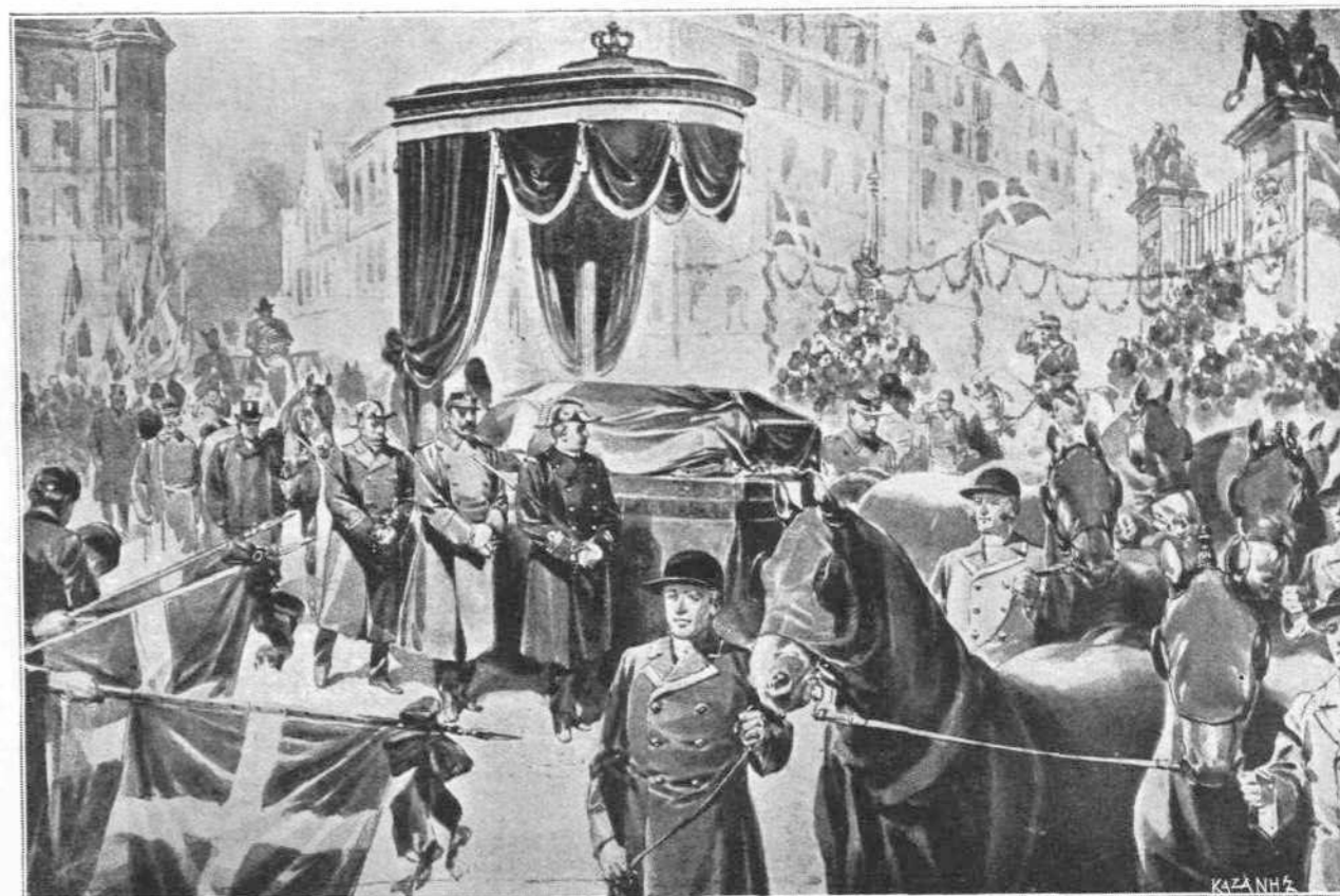
Η ΚΗΔΕΙΑ ΤΟΥ ΒΑΣΙΛΕΩΣ ΧΡΙΣΤΙΑΝΟΥ ΔΙΑ ΜΕΣΟΥ ΤΩΝ ΟΔΩΝ ΤΗΣ ΚΟΠΕΝΑΓΗΣ