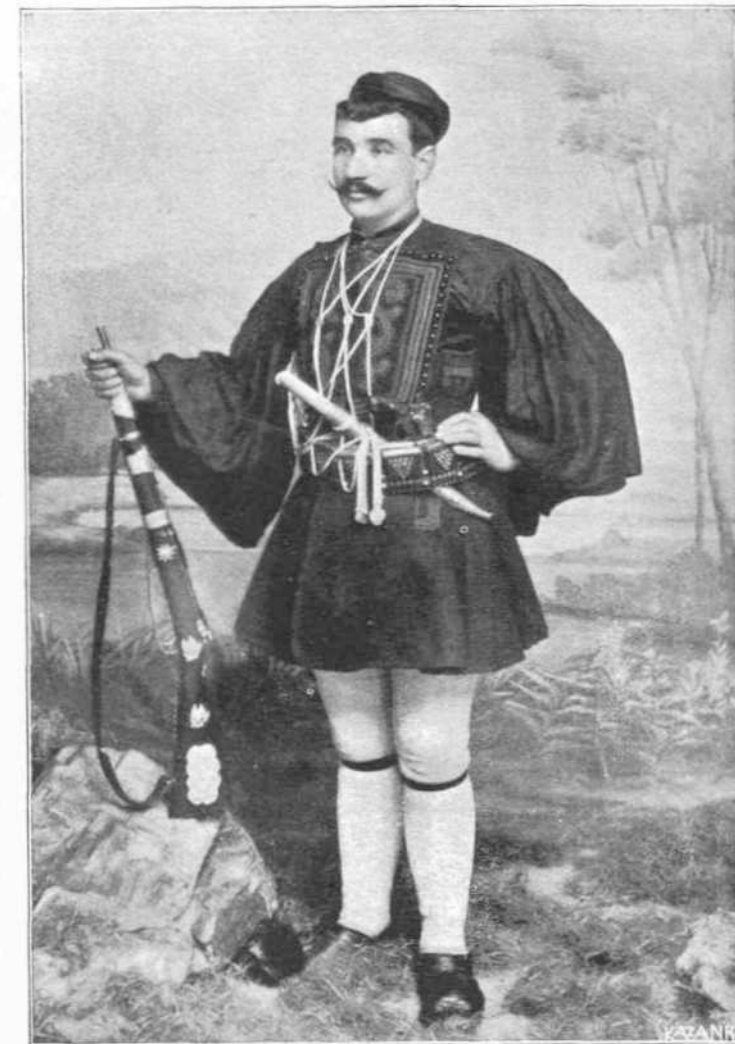
ΓΕΩΡΓΙΟΣ ΒΟΛΑΝΗΣ Ὀπλαρχηγὸς ἐκ Λάκκων τῆς Κρήτης.

των μεταβάντος ἐκεῖ. Ὁ ὀπλαρχηγὸς Γεώργιος Βολάνης συνητήθη ἐν Μακεδονίᾳ μὲ τὸν ἀειμνήστον Παῦλον Μελά καὶ ἠκολούθησεν αὐτόν, ὡς ὀπλαρχηγός, κατὰ δὲ τὴν εἰς Σιάτισταν ἀτυχῆ συμπλοκῆν τοῦ σώματος Μελά μετὰ τοῦ τουρκικοῦ στρατοῦ, ὁ γενναῖος Βολάνης περιεκκλωθεὶς ἐν πληθοκίστω ὀκίᾳ τοῦ αὐτοῦ χωρίου, παρέμεινε ἀμυνόμενος ἐν αὐτῇ ἐπὶ εἰκοσιπέσσαρας ὥρας, ἕως οὐ ἐξαντληθέντων τῶν πολεμφοδίων του, ἠγναγκάσθη νὰ παραδοθῇ μετὰ τῶν λοιπῶν ὀπαδῶν του εἰς τὸν ἀξιοματικόν τοῦ στρατοῦ. Βραδύτερον κατεδικάσθησαν