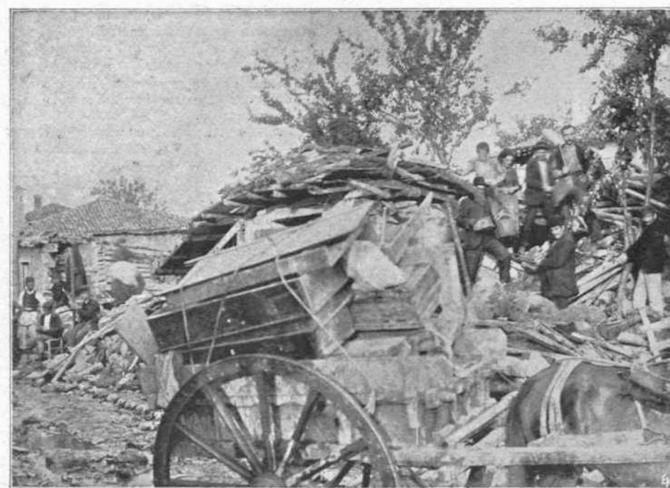
Ο ΠΑΝΙΚΟΣ ΤΩΝ ΚΑΤΟΙΚΩΝ