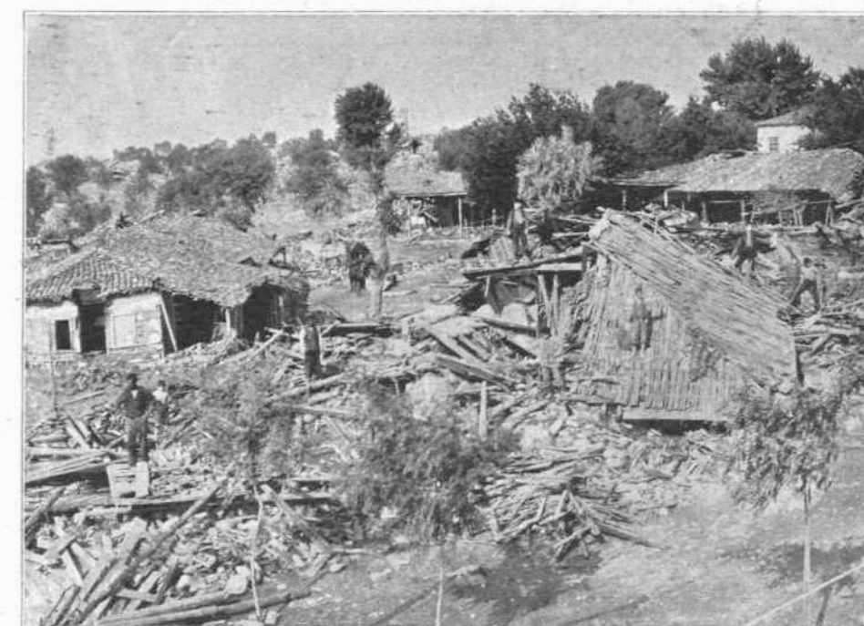
ΜΕΤΑ ΤΗΝ ΚΑΤΑΣΤΡΟΦΗΝ