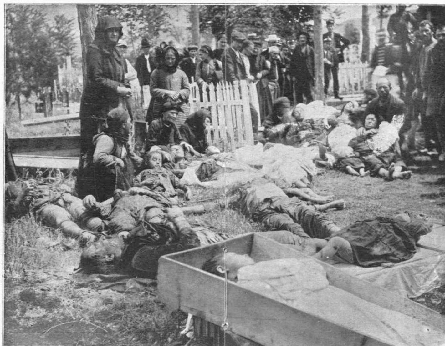
ΠΑΙΔΙΑ, ΓΥΝΑΙΚΕΣ ΚΑΙ ΓΕΡΟΝΤΕΣ ΕΥΡΟΝΤΕΣ ΤΟΝ ΘΑΝΑΤΟΝ ΕΣΩΡΕΥΟΝΤΟ ΕΙΣ ΤΟ ΝΕΚΡΟΤΑΦΕΙΟΝ