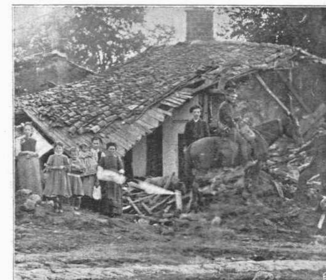
ΕΡΕΙΠΙΑ ΤΗΣ ΣΥΝΟΙΚΙΑΣ ΤΡΙΚΑΝΟΓΛΟΥ