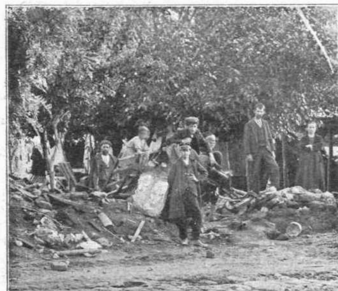
ΕΡΕΙΠΙΑ ΤΗΣ ΣΥΝΟΙΚΙΑΣ ΤΡΙΚΑΝΟΓΛΟΥ