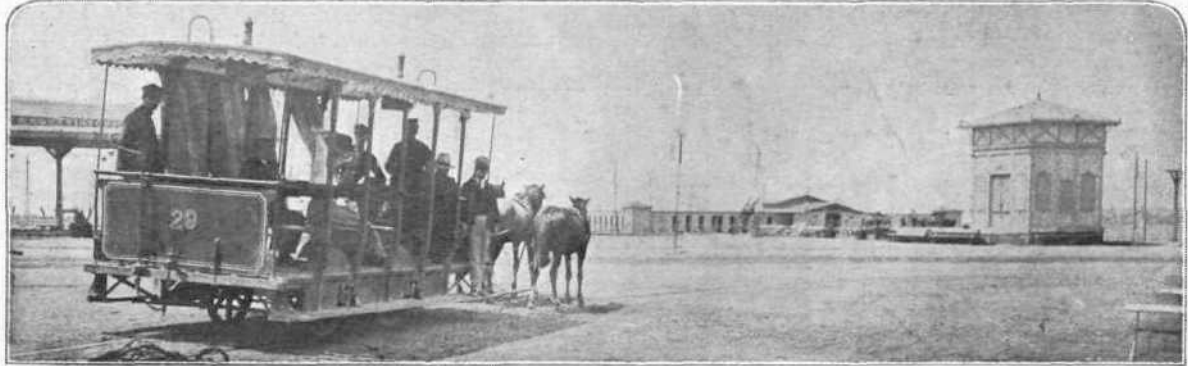
ΤΑ ΧΑΛΙΑ ΤΟΥ ΤΡΟΧΙΟΔΡΟΜΟΥ