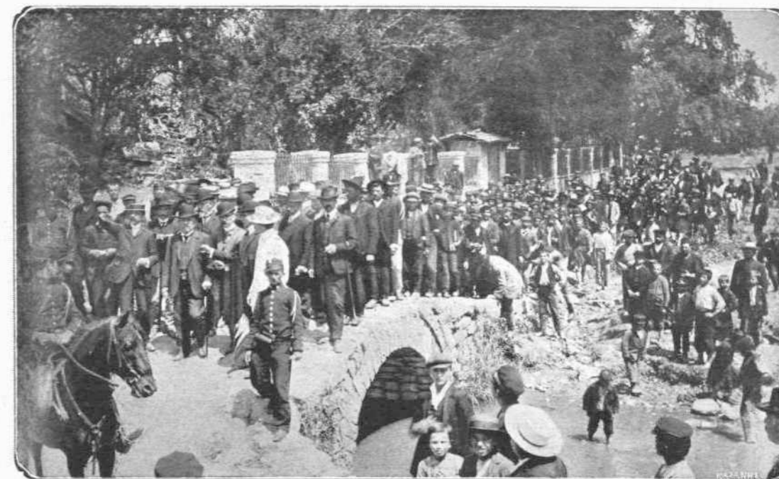
Ο ΥΠΟΥΡΓΟΣ ΤΩΝ ΕΣΩΤΕΡΙΚΩΝ Ν. ΚΑΛΟΓΕΡΟΠΟΥΛΟΣ ΕΠΙΣΚΕΠΤΟΜΕΝΟΣ ΜΕΤΑ ΤΩΝ ΑΡΧΩΝ ΤΡΙΚΚΑΛΩΝ ΤΑ ΕΡΕΙΠΙΑ