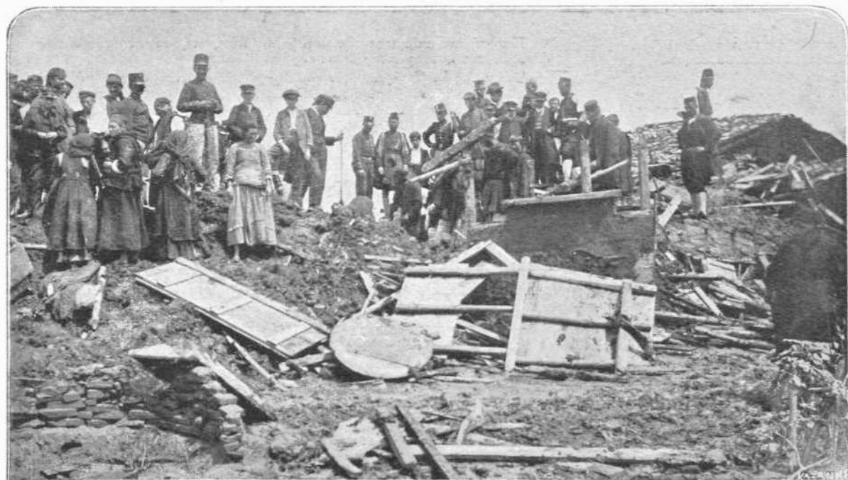
Η ΚΑΤΑΡΡΕΥΣΑ ΟΙΚΙΑ ΕΞ ΗΣ ΕΞΗΧΘΗΣΑΝ ΤΑ 48 ΠΤΩΜΑΤΑ