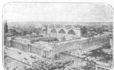
Ο ΣΤΑΘΜΟΣ ΤΟΥ ΣΙΣΗΡΟΔΡ. ΠΑΝΕΥΒΑΝΙΑΣ

Τα σχολεία ταύτα διαοροῦνται 1 ον εις κοινά σχολεία, τα όποια υποδιδασκούνται εις στοιχειώδη η προκαταρκτικά, 2 ον εις άνώτερα, και 3 ον εις κολλέγια η πανεπιστήμια.