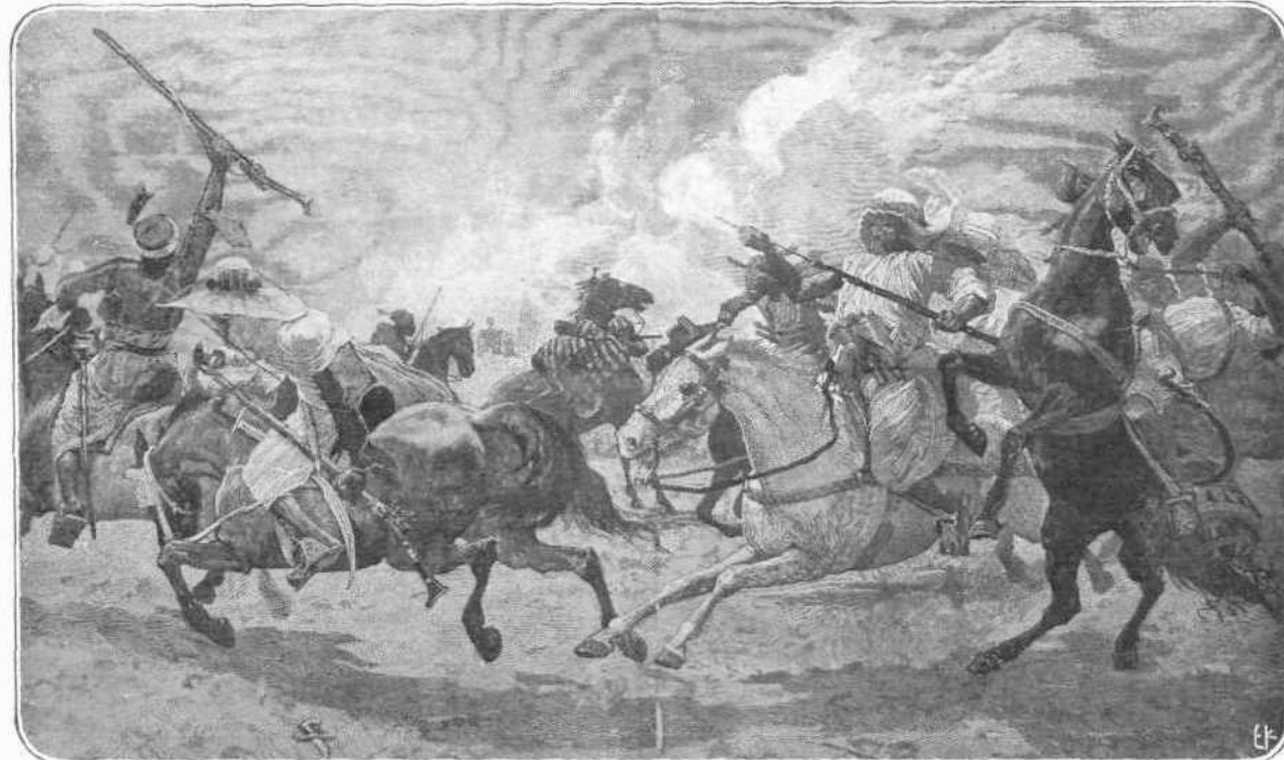
ΑΠΟ ΤΑΣ ΑΙΜΑΤΩΜΕΝΑΣ ΠΕΔΙΑΔΑΣ ΤΗΣ ΤΡΙΠΟΛΙΤΙΔΟΣ.— ΙΘΑΓΕΝΕΙΣ ΙΠΠΕΙΣ ΕΠΙΤΙΘΕΜΕΝΟΙ ΚΑΤΑ ΤΩΝ ΙΤΑΛΩΝ