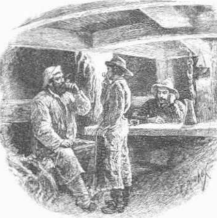
— Παιδί μου, παρακάλεϊ τον Θεόν να μη σε άξιώση ποτέ να ίδης έκείνο που εϊνε έκεί μέσα.