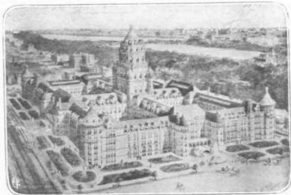
ΤΟ ΑΜΕΡΙΚΑΝΙΚΟΝ ΜΟΥΣΕΙΟΝ ΤΗΣ ΦΥΣΙΚΗΣ ΙΣΤΟΡΙΑΣ

Η των Δυτικών Ίνδιων Έταιρεία όμως είχε δώσει οδηγία εις τον Minuet, να διαπραγματευθή μετά των Ίνδιων τας δια το κληρίον προορισμένας γαίας των, προτού προηί εις ανέγερσιν οικοδομών. Και επιθεωρών τρόπον τινά την νήσον Manhattan, η οποία είχαν ορίσει ως μέρος στρατιωτικών ενεργειών, υπελόγησε την έκτασιν εις είκοσι δύο περίπου χιλιάδας στρέμματα. Έκάλεσε τότε μερικούς εκ των επισημοτέρων Ίνδιων άρχηγών, και τους προσέφερε κομβόλογια, κομβία και άλλα είδη κοσμημάτων εις άντάλλαγμα της ιδιοκτησίας των. Έδέχθησαν τους όρους μετ' ειλικρινούς χαράς, και η συμφωνία ετελείωσεν άμέσως. Η αξία των άθυρμάτων, δια των οποίων εξησφαλίσθη ο τίτλος της ιδιοκτησίας της νήσου Manhattan ήτο 24 περίπου δολάρια.