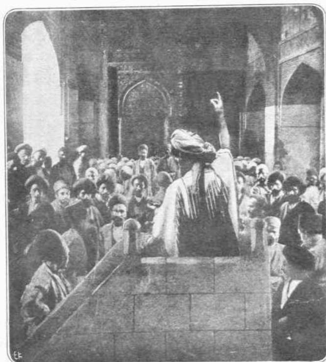
ΠΡΟΚΗΡΥΞΙΣ ΤΟΥ ΙΕΡΟΥ ΠΟΛΕΜΟΥ ΕΙΣ ΤΗΝ ΤΡΙΠΟΛΙΤΙΑ

Πρός ανατολάς της πόλεως, 1 1/2 ώραν περίπου μακράν ταύτης, επί του μέσου της δυσμικής κλιτύς του Όλύμπου, άνεκαλύφθη σπήλαιον, έν ό εφθεβήσαν λίθινα έργαλεία και τεμάχια άγγείων, προσερχόμενα εκ των προϊστορικών χρόνων της Ελλάδος, διά τούτων δέ άποδεικνύεται ότι, εκει πλησίον, ίσως έν τη πεδιάδι της Βάβειας, ύπήρχε συνοικισμός τις τουλάχιστον 2000 έτη π.Χ., αλλά ποία ήτο ή σχέσις τούτου πρός την μετά ταύτα Έρετρίαν, δέν εινε δυνατόν νά γνωρίζωμεν.