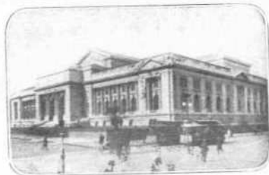
Η ΔΗΜΟΣΙΑ ΒΙΒΛΙΟΘΗΚΗ ΤΗΣ Ν. ΥΟΡΚΗΣ

Η των Δυτικών Ίνδιων Έταιρεία όμως είχε δώσει οδηγία εις τον Minuet, να διαπραγματευθή μετά των Ίνδιων τας δια το κληρίον προορισμένας γαίας των, προτού προηί εις ανέγερσιν οικοδομών. Και επιθεωρών τρόπον τινά την νήσον Manhattan, η οποία είχαν ορίσει ως μέρος στρατιωτικών ενεργειών, υπελόγησε την έκτασιν εις είκοσι δύο περίπου χιλιάδας στρέμματα. Έκάλεσε τότε μερικούς εκ των επισημοτέρων Ίνδιων άρχηγών, και τους προσέφερε κομβόλογια, κομβία και άλλα είδη κοσμημάτων εις άντάλλαγμα της ιδιοκτησίας των. Έδέχθησαν τους όρους μετ' ειλικρινούς χαράς, και η συμφωνία ετελείωσεν άμέσως. Η αξία των άθυρμάτων, δια των οποίων εξησφαλίσθη ο τίτλος της ιδιοκτησίας της νήσου Manhattan ήτο 24 περίπου δολάρια.