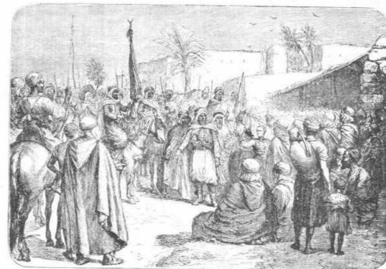
ΠΡΟΚΗΡΥΞΙΣ ΤΟΥ ΙΕΡΟΥ ΠΟΛΕΜΟΥ ΕΙΣ ΤΑ ΕΝΔΟΤΕΡΑ ΤΗΣ ΤΡΙΠΟΛΙΤΙΔΟΣ

Όλα τά επαναστατικά κινήματα έν Άλγερία από του 1830 και ένταύθεν παρουσιάζουν τά χαρακτηριστικά Ιερου πολέμου. Ό κυριώτερος άρχηγός της επαναστάσεως, ό Αβδελ Καδέρ, όλην τόν την δημοτικότητα την ώφειλεν εις μίαν έταιρείαν, της όποιάς ήτο μέλος, εις την Μυστικήν Θρησκευτικήν Έταιρείαν