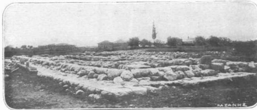
Ο ΝΑΟΣ ΤΟΥ ΔΑΦΝΗΦΟΡΟΥ ΑΠΟΛΛΩΝΟΣ