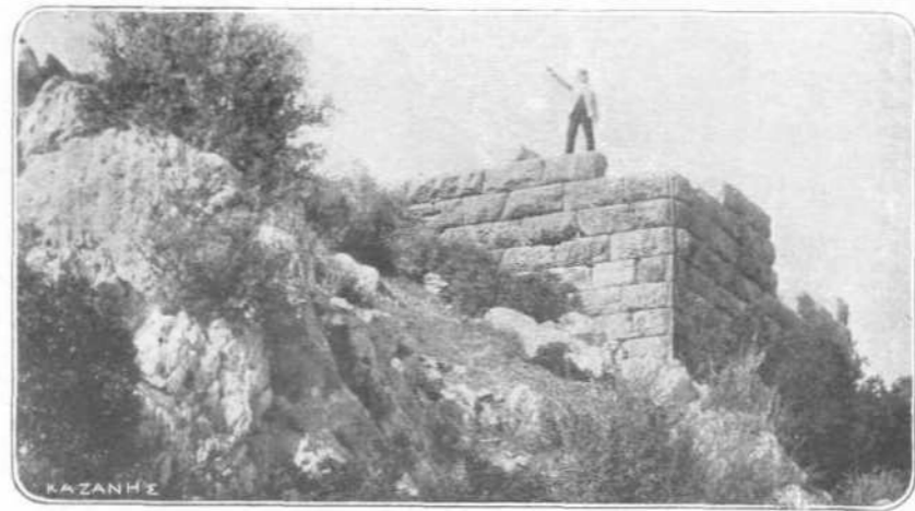
ΠΥΡΓΟΣ ΤΟΥ ΦΡΟΥΡΙΟΥ ΤΗΣ ΕΡΕΤΡΙΑΣ

Λείψανα της ἀρχαίας Ερετριεῖς εὐρίσκονται μέχρι των πρώτων χριστιανικῶν χρόνων. Μετὰ ταῦτα φαίνεται ότι ἠρημώθη ἡ πόλις μέχρι της