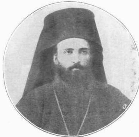
Ο ΓΓΕΒΕΝΩΝ ΛΙΜΙΛΙΑΝΟΣ

... Κτισάτε Πολεμάρχοι μὲ λησμορεῖτε τὸ σχοιρὶ, παιδιά, τοῦ Πατριάρχου!