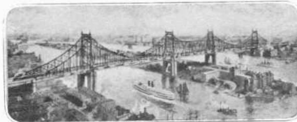
Η ΕΠΙ ΤΟΥ ΟΥΔΑΣΜΟΣ ΜΕΓΑΛΗ ΓΕΦΥΡΑ QUEENSBORO

Αι πρώται ύλαι αι χρησιμοποιούμεναι εις τα εργοστάσια της Νέας Υόρκης ετησίως υπερβαίνον το 1,000,000,000 δολ. η δὲ αξία της χονδρικής πωλήσεως