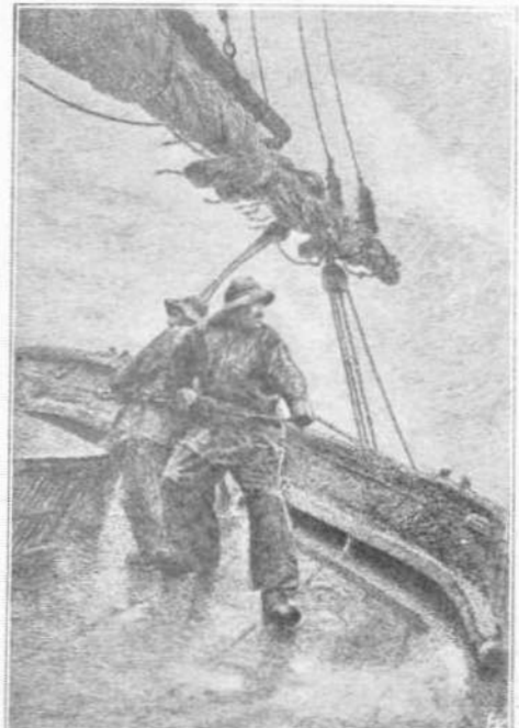
Η θύελλα έμείνετο ο Έθαγγελισμός, έχόρνε, έχόρνε...

Ο Άγιος όμως δέν ήκουε και ο καπετάν Μπρέσσα έφράττατε.