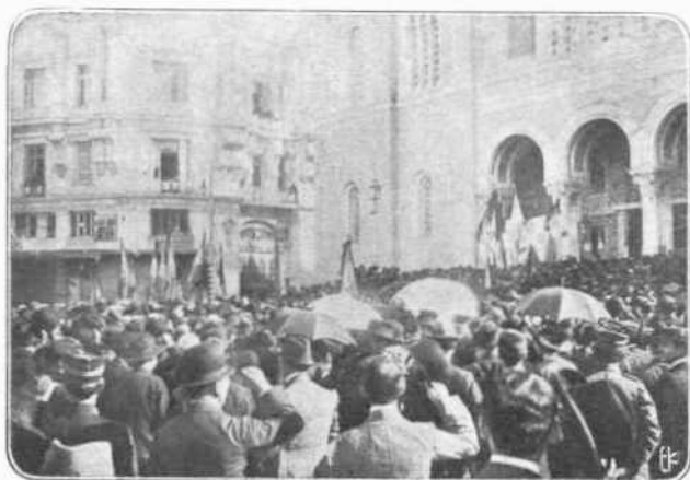
ΤΟ ΕΝ ΑΘΗΝΑΙΣ ΠΑΝΗΜΟΝ ΜΗΜΟΣΥΝΟΝ ΤΟΥ ΘΥΜΑΤΟΣ ΤΩΝ ΓΡΕΒΕΝΩΝ

Αι εικόνας του καταλλήλοι σχεδόν πάντοτε και έντέχνως προσήρ-