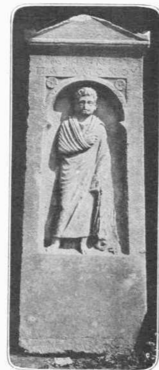
ΕΠΙΤΥΜΒΙΟΝ ΑΝΑΓΛΥΦΟΝ ΡΩΜ. ΧΡΟΝΩΝ ΕΥΡΕΘΕΝ ΕΝ ΕΡΕΤΡΙΑ