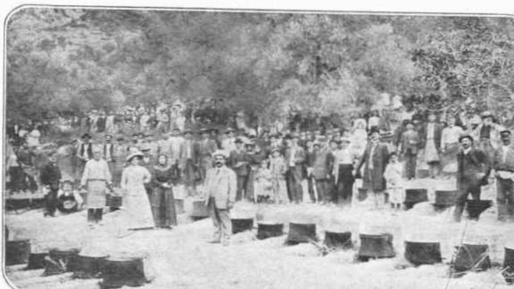
ΑΠΟ ΤΗΝ ΕΟΡΤΗΝ ΤΗΣ ΚΥΜΗΣ.— ΕΝΑ ΓΕΥΜΑ ΑΠΟ 111 ΚΑΖΑΝΙΑ ΕΙΣ ΤΟ ΟΠΟΙΟΝ ΠΑΡΕΚΑΘΗΣΑΝ 8,000 ΑΤΟΜΑ

Η «Εικονογραφημένη» με στοργήν παρακολουθεί τά έν τή έξωτερική Έλληνικά σωματεία, τά όποια, από φιλοτέχνους άποτελούμενα, συντη- ρουσι και διαδίδουσι τας εύγενείς ιδέας της Τέχνης ή τών Γραμμάτων