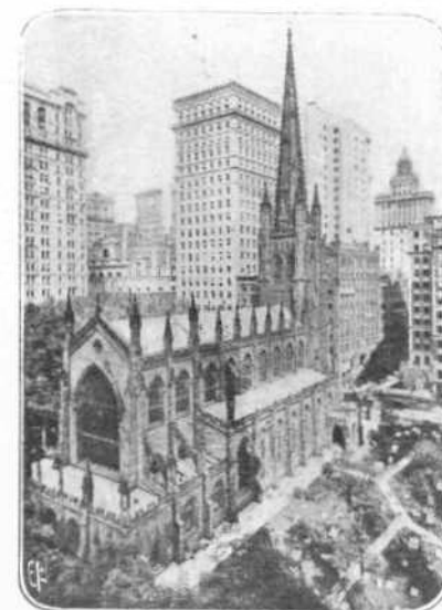
Ο ΝΑΟΣ ΤΗΣ ΑΓΙΑΣ ΤΡΙΑΔΟΣ ΕΝ ΝΕΑΙ ΥΟΡΚΗΙ