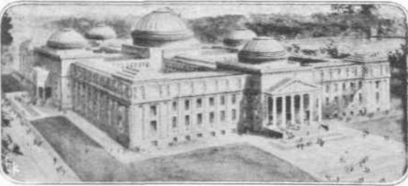
ΤΟ ΕΝ ΜΠΡΟΚΛΙΝ ΙΝΣΤΙΤΟΥΤΟΝ ΤΩΝ ΤΕΧΝΩΝ ΚΑΙ ΕΠΙΣΤΗΜΩΝ

Κατά τήν εποχήν εκείνην εσηματίσθησαν έταιρία διάφοροι προς έμμετάλλεισιν των ήδη ανακαλυφθέντων μερών και προς ανακάλυψιν νέων τοιούτων. Μία εκ των εταιριών τούτων ήτο και ή «Ολλανδική Έταιρία των Άνατολ. Ίνδιων». Το φθινόπωρον του 1608 ο Hudson προσεκήθη υπό τής Έταιρίας των Ανατολικών Ίνδιων εις Ολλανδίαν, διά του ιστορικού Van Meteren, Υπουργού τότε τής Ολλανδίας παρὰ τῇ Αύλῃ του Αγίου Ίακώβου. Ο περίφημος θαλασσοπόρος δέν ήργησε να φθάσῃ εις Χάγην, γενόμενος δεκτός μετά πολλών τιμών. Μετά μακρην αναβολήν άπεφασίσθη επί τέλους ή άποστολή υπό τήν άρχηγίαν του Hudson. Το Έπιμελητήριον του Άμστερδαμ ανέλαβε να καλύψῃ τά έξοδα τής άποστολής. Ηγοράσθη μία Ολλανδική γολέτα 80 τόννων, και με πλήρωμα δέκα οὔτω άνδρων, Ολλανδών και Άγγλων, ο μέγας θαλασσοπόρος εγκατέλειπε τον λιμένα του Άμστερδαμ τήν 4ην Απριλίου 1609.