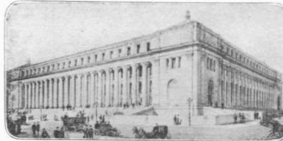
ΤΟ ΜΕΓΑΡΟΝ ΤΩΝ ΤΑΧΥΓΡΑΜΕΙΩΝ ΤΗΣ ΝΕΑΣ ΥΟΡΚΗΣ

Ο Hudson έλαβεν οδηγίας να πλεύσῃ βορείως και βορειοανατολικώς τής Nova Zembla, να μὴν ακολουθήσῃ δ' άλλην οδόν. Εύρεν όμως τήν θάλασσαν πλήρη πάγων προς τό μέρος τούτο. Είς ταιούτον δε βαθμόν έφθασε τό πηγος, ώστε οί ναῦται επάγωνσαν και κατέστησαν άνίκανοι προς εργασίαν. Άπαξ ή δισ τό πλοίον διέφυγε τον κίνδυνον των άγνώστον ρευσμάτων, σωθέν ως εκ θαύματος, όποτε βουνά πάγου τό περιέβωσαν και τό περιεσφρίσαν. Τοσοῦτον δε κατερόμαξε τό πλήρωμα, ώστε επανεσπάρτησεν. Ο Hudson ήναγκάσθη ν' άλλάζῃ δρόμον. Έστρεψε τήν πρώραν του μικρού του πλοίου «Ημισελήνου» δυτικώς, και μετά μακρόν και περιπετειώδη πλοῦν, άπώλεσας τον έτερον των ιστών, έφθασεν εις τήν Newfoundland. Το άτύχημα τούτο τον ήνάγκασε να εισέλθῃ εις τό Saga-