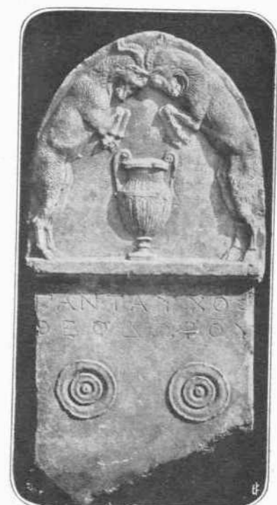
ΕΠΙΤΥΜΒΙΟΝ ΑΝΑΓΛΥΦΟΝ ΕΛΛΗΝ. ΧΡΟΝΩΝ ΕΥΡΕΘΕΝ ΕΝ ΕΡΕΤΡΙΑ