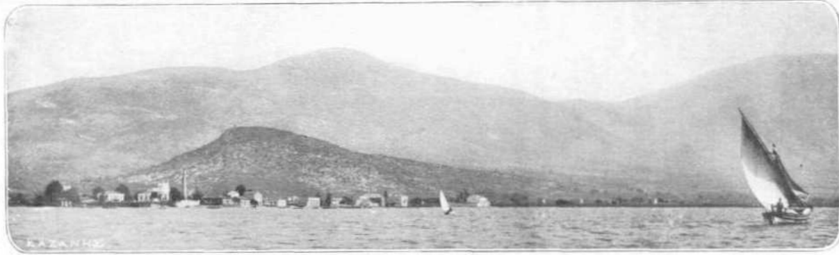
ΑΠΟΨΙΣ ΤΩΝ ΝΕΩΝ ΨΑΡΩΝ (ΑΡΧΑΙΑΣ ΕΡΕΤΡΙΑΣ)

Ἡ αὐτὴ ιδιότης εὐρίσκειται και εν τη διαλέκτῳ της Ἡλίδος, ἐξ οὗ προήλθε και ἡ ἕτερα παράδοσις του Στράβωνος περί ἀποικίας εις Ερέτριαν εκ της παρὰ την Ἠλεικὴν χώραν κειμένης Μακίστου. Ἐπειδὴ δ' ὁμοῦ ἡ ιδιότης της μετατροπῆς του σ εις ρ ἀπαντᾷ κυρίως εν Θεσσαλίᾳ και ἐπειδὴ και οἱ τὰ βορειότερα μέρη της Εββοῖας κατοικοῦντες Ἑλλοπες ἦσαν Θεσσαλοί, πιθανώτερον εἶνε ότι, και οἱ πρώτοι Ερετριεῖς ἦλθον εκ Θεσσαλίας. Εἶνε δὲ γνωστὸν, ότι ὑπῆρχε και πόλις Ερέτρια εν Θεσσαλίᾳ πλησίον της Φαρσάλου, ὅπως πάλιν ὀνομάζεται και εν Ἀθήναις χωρίον τι, ἔνθα βραδύτερον ἦτο ἡ ἀγορά, Ερέτρια. Κατὰ τὸν 8 ον π. Χ. αἰῶνα ἡ Ερέτρια εὐρίσκειτο εν τη μεγίστῃ ἀκμῇ της δυνάμεώς της· τὸ κράτος αὐτῆς ἐξετείνεται ἐπὶ του