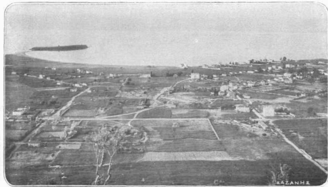
ΤΑ ΝΕΑ ΨΑΡΑ—Η ΣΗΜΕΡΙΝΗ ΕΡΕΤΡΙΑ

πλείστου της νοτίου Εββοῖας και πρὸς ἀνατολὰς δ' ἔφθανε και μέχρι των πρὸς τὸ Αἰγαῖον Εββοϊκῶν ἀκτῶν. Αἱ νῆσοι Ἀνδρος, Τήνος και Κέα, ὑπῆγοντο ὡσαύτως εις τὸ κράτος της. Ἐπὶ ἀρχαιοτάτης στήλης εὐρισκομένης εν τῷ ἱερῷ της Ἀμαρυσίας Ἀρτέμιδος, τῷ διασημοτάτῳ εν Ερέτρίᾳ, ἦν ἐκκαλοῦντο οἱ ἀρχαῖοι πρὸς ἐπίδειξιν του παλαιοῦ μεγαλείου της Ερετριεῖς, ἐγράφετο ότι, την πομπήν, ἦν ἦγον ετησίως κατὰ την εορτήν των Ἀμαρυσίων, ἠκολούθουν 3,000 ὄπλιται και 600 ἵππεις.