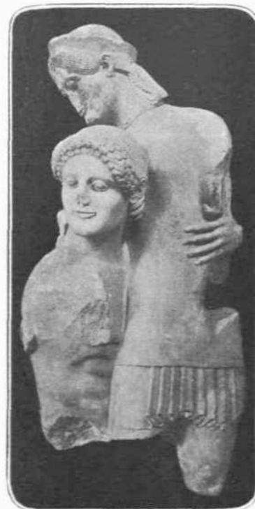
ΘΗΣΕΥΣ ΚΑΙ ΑΝΤΙΟΠΗ ΑΠΟ ΤΑ ΛΕΙΨΑΝΑΤΑ ΤΟΥ ΕΝ ΕΡΕΤΡΙΑΙ ΝΑΟΥ ΤΟΥ ΔΑΦΝΗΦΟΡΟΥ ΑΠΟΛΛΩΝΟΣ

ἐπανιδρύσεως αὐτῆς διὰ της ἐποικίσεως των Ψαριανῶν ὑπὸ του Ὄθωνος.