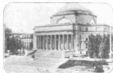
Η ΒΙΒΛΙΟΘΗΚΗ ΤΟΥ ΠΑΝΕΠΙΣΤΗΜΙΟΥ ΚΟΛΟΜΒΙΑΣ

των παραθέντων βιομηχανικών ειδών κατά το 1909 υπελογίσθη 2,248,440,435 δολάρια, ήτοι το τετραπλάσιον της αξίας των βιομηχανικών ειδών, τα όποια έξήγαγον κατά την αυτήν περίοδον η Γαλλία και Γερμανία όμοῦ.