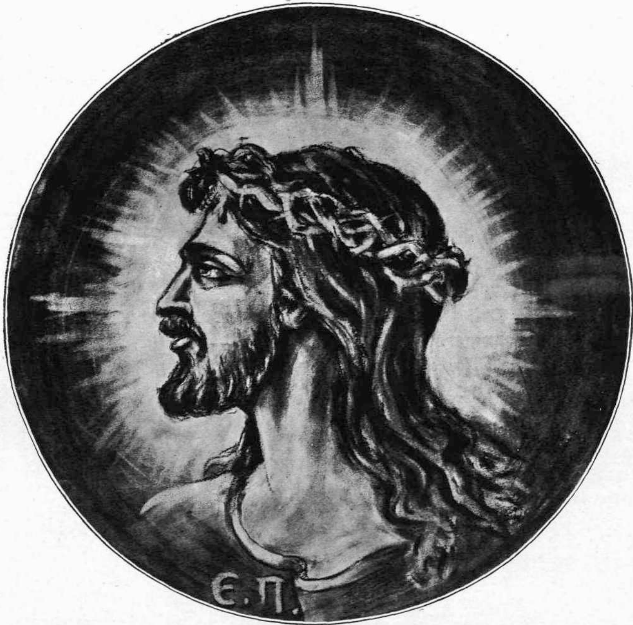
Ο ΜΕΓΑΣ ΑΛΤΡΟΥΪΣΤΗΣ