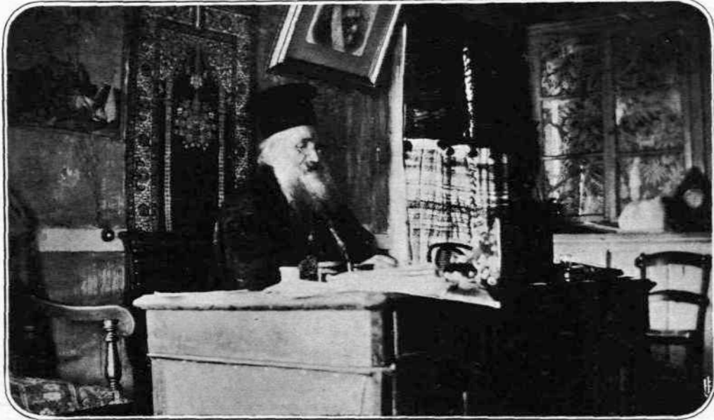
ΑΠΟ ΤΟΝ ΑΓΩΝΑ ΤΗΣ ΗΠΕΙΡΟΥ.—Ο Μητροπολίτης Άργυροκάστρου, Υπουργός της Αυτόνομον Κυβερνήσεως.

Η εξαγωγή της πολυτιμου ταύτης ούσιας άποτελεί δυσκολοτάτην και περιπλοκον έργασίαν. Όπως άνταποκριθί εν τούτοις ή εταιρεία εις την όσημέραι αύξουσαν ζήτησιν του Ραδίου εκ μέρους νοσοκομειων δια τας ανάγκας του χειρουργικού και Ιατρικού κόσμου, προσθέτει νέα έργαστήρια, δια των οποίων θ' αύξηθί εις το πενταπλάσιον ή Ραδιοπαραγωγή.