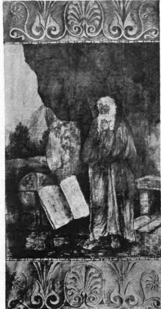
ΕΝΑ ΘΑΥΜΑΣΙΟΝ ΧΕΙΡΟΤΕΧΝΗΜΑ