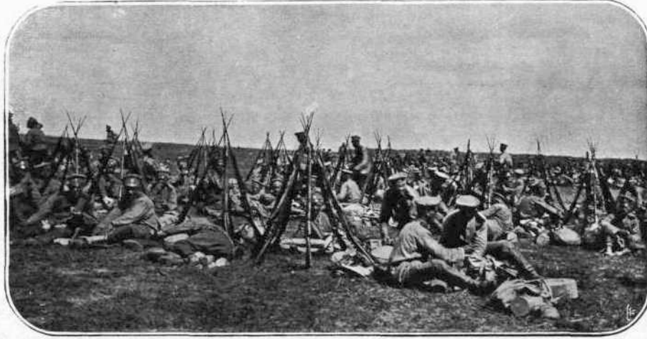
ΕΙΣ ΤΗΝ ΠΡΖΕΣΜΥΖΑ. — Όγκοι μεγάλοι Ρωσικού στρατοῦ ἀπέκλεισαν...