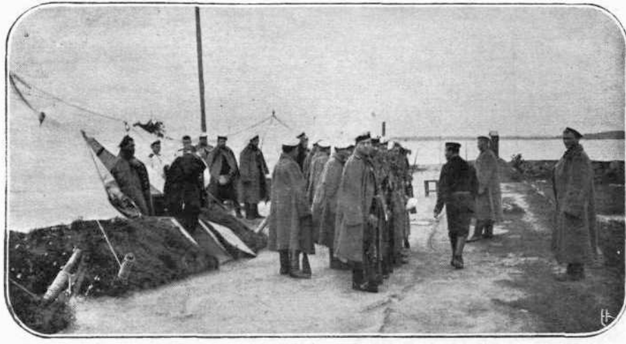
ΠΑΡΑ ΤΟΝ ΒΙΣΤΟΥΛΑΝ. — Οι Ρώσοι δὲν προφθάνουν νὰ κατασηκώσουν...