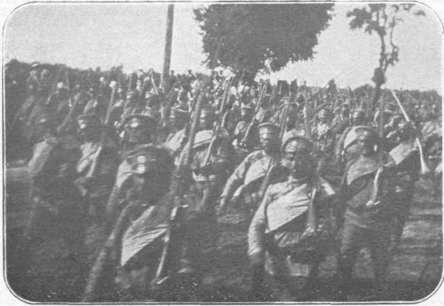
ΚΑΤΑ ΤΗΣ ΚΡΑΚΟΒΙΑΣ. — Τὰ γενναία στρατεύματα τοῦ Τσαίου...