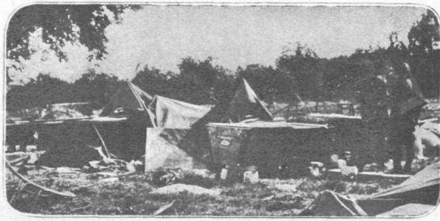
ΚΑΙ ΖΥΜΩΤΗΡΙΑ. —Η Γερμανική επιμελητεία δεν μεταφέρει ψωμί δια τόν μαχόμενον στρατόν από τάς πλησίον πόλεις. Έχει φορητά ζυμωτήρια και φορητούς φούρνους. Άλλ' εις τήν μάχην του Μάρν οι Γερμανοί φεύγοντες αφήκαν και ζυμωτήρια και φούρνους... με καρβέλια.

Άρκει να είπωμεν ότι, συνδρομηταί τής, έρχόμενοι εδώ δια να ταχθούν υπό τάς σημαίας ή φεύγοντες δια τήν εκστρατείαν, ήρχοντο εις τά Γραφεία μας δια να