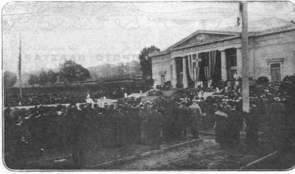
ΑΠΟ ΤΟΝ ΑΓΙΟΝ ΦΡΑΓΚΙΣΚΟΝ.—Τὸ κορφοῖμα τῶν ἐσθῶν ἦτο ἡ εἰς τὴν Α. Μ. τὸν Βασιλέα Κωνσταντῖνον ἀπερωθήμενὴ ἡμέρα, μὲ τὴν ὅποιαν ἔξετελλάσθησαν Ρωμηοὶ καὶ Ἀμερικανοί.

Ἐννοεῖται ὅτι τὸ Περίπερόν μας ἐγκαινίσθη ἐν πάσῃ μεγαλοπρεπείᾳ, ἐπ' εὐκαιρίᾳ δὲ, προσηγορευομένης τῆς 1 ο ς Λόθ Φύλλερ, ἀναπαρεστάθη, μὲ περισσὴν ἐπιτυχίαν, ἡ ἀρχαία καὶ μεγαλοπρεπὴς πομπὴ τῶν Παναθηναίων. Εἰς τὸ Περίπερόν μας μέσα ἐσωράσθη καὶ ἡ εἰς τὴν Α. Μ. Τὸν Βασιλέα ἀπερωθέισα