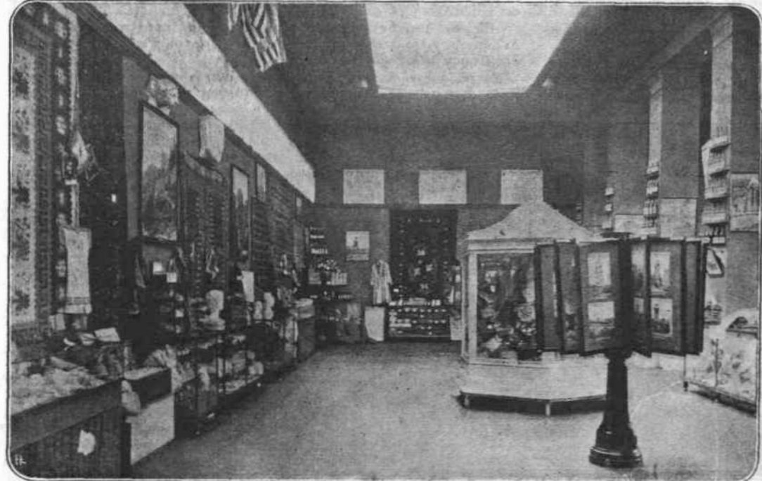
ΑΠΟ ΤΟΝ ΑΓ. ΦΡΑΓΚΙΣΚΟΝ.—Τὸ περίτερον τὸ ὅποιον ἠτοιμάσθη ἐνεργείᾳ τῆς τῆς ἐδῶ Ὀργανωτικῆς Ἐπιτροπῆς εἰς τὴν ἐν Ἁγ. Φραγκίσκῳ Παγκόσμιον Ἐκθεσίν, ἦτον ἀληθινὰ ἓνα κομμάτι τῆς Ἑλλάδος, μὲ τὴν ὠραιότερον ἔχοντα νὰ δεῖξομεν.