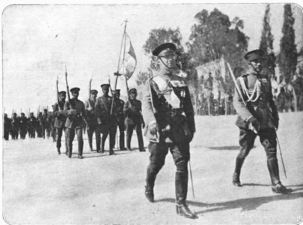
Η ΕΠΕΤΕΙΟΣ ΤΩΝ ΙΩΑΝΝΙΝΩΝ

Μια όραία στρατιωτική εορτή έλαβε χώραν εις τὰ Παράκτματα του Πεζικού επί τη τρίτη έπετειώ της παραδόσεως των Ιωαννίνων, εις ην παρέστη ο Βασιλεύς, οι Πρίγκιπες και όλοι οι έπίσημοι. Μετά τώ πέρας της τελετής και όταν έτελείωσεν ή επίδειξις, τά σώματα ήρχισαν να παρελαύνουν από του Βασιλέως, πρώτον δε παρέλασε τό 1 πεζικόν σύνταγμα, έν τάγμα του οποίου διοικεί ή Α. Υ. ο Διάδοχος.