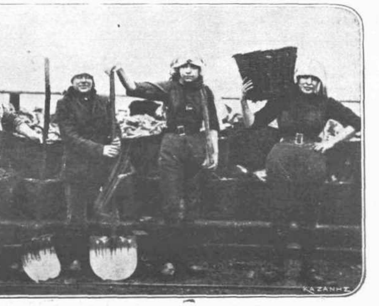
ΕΛΛΕΨΙΣ ΑΝΑΡΘΩΝ.—Είναι αδύνατον νά φαντασθή κανείς τί γίνεται εις την Γερμανίαν, όπου όλοι οι άνδρες, γέροι, νέοι και παιδιά, όλοι οι δυνάμειοι νά φέρουν όπλα, είναι εις τά άπειρα μέτωπα του πολέμου. Μίαν ιδέαν δειν η εικόνη μας αυτή, παριστάω Γερμανίδας, αι όλοιαι έφηραν την σκαπάνην και τό πτόνον και άντακαυστόν τους μαχημένους άνδρας, άσκη και εις τάς χριστιανικάς λαμαίας.

Μετιόφρων δε. «Δεν ύπογράφω τά χειρόγραφα μου, ειπεν εις κάποιον που την ήρώτησε διατί προτιμά τό ψευδώνυμον, διότι όταν εύρίσκωμαι από της βιβλιοθήκης μου και βλέπω την παραγωγήν του