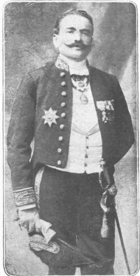
ΜΙΛΤΙΑΔΗΣ ΡΑΦΑΗΛ Γενικὸς Πρόξενος τῆς Ἑλλάδος ἐν Ἱεροσολύμοις.

Ἡ ὄλη ἐν γένει πατριωτικὴ ἐργασία τοῦ Κωνστ. Δημαρᾶ ἐν τῇ ἐπιμελείᾳ τῶν ἀνατεθειμένων αὐτῷ ἔθν. συμφερόντων κατέχει τιμητικώτατην διὰ τὴν μνήμην αὐτοῦ θέσιν ἐν τῇ ἡμετέρᾳ Ἱστορίᾳ τῶν τελευταίων χρόνων καὶ ἀποτελεῖ ἀληθῶς ζῆμιαν ἀνυπολόγιστον διὰ τὴν Ἑλληνικὴν πολιτείαν ἢ πρόωρος ἀπώλεια τοιοῦτου διακεκριμένου ὑπαλλήλου.