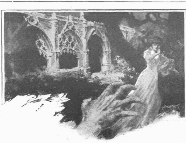
ΟΙ ΑΟΡΑΤΟΙ ΚΟΣΜΟΙ: ΟΝΕΙΡΑ ΠΡΟΑΙΣΘΗΤΙΚΑ