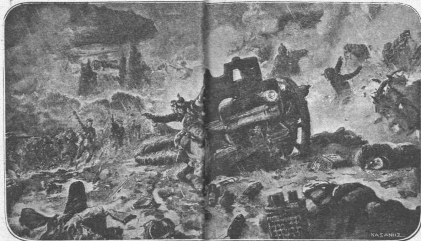
ΝΤΟΥΩΜΟΝ.—Γαλλικὸν πέλκιον, βοηθούμενον ἀπὸ τὰ πυροβόλα, σκοπεῖ τὸν θάνατον εἰς τὰς τάξεις μιᾶς φάλαγγος τῆς στρατιάς τοῦ Κρόνπριντς, τὴν ὁποίαν ἐξεδίωσαν ἐπίθεσιν ἀπὸ τὰ χαρακώματά της.