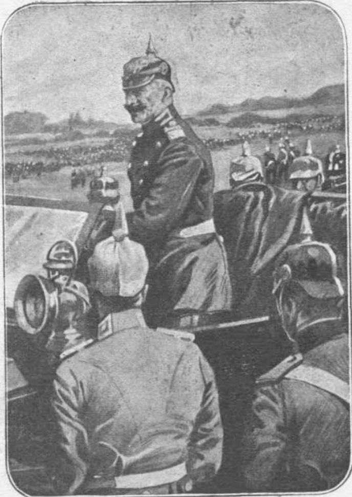
Ο ΚΑΤΣΕΡ! — Μέσα εις τὸ φέρον τὰ Αὐτοκρατορικά ἔμβληματα αὐτοκίνητόν του διατρέχει νύκτα καὶ ἡμέραν τὴν Γερμανικὴν παρατάξιν πρὸ τοῦ Βεροῦν. ἀεικίνητος, παρορμῶν καὶ ἐνθουσιάζων.