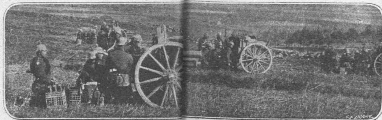
Εἰς τὸ ΒΔ.—Τὸ Γερμανικὸν πυροβολικὸν γράφει τὴν ὁδὸν διὰ τὰ Γερμανικὰ ὄπλα κατὰ τὸς ἐναντίον τοῦ Βθ ἐπιθέσεις του.