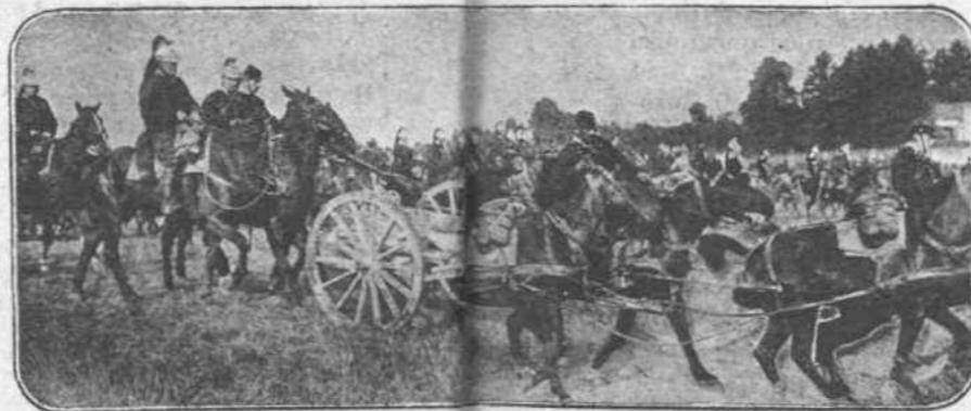
Εἰς τὴν ΒΑΛΚΑΝΙΚΗΝ.—Τὰ Γαλλικὰ περνοῦν τὰς Μακεδονικὰς πεδιάδας καὶ ὁδεύουν εἰς τὴν πρώτην γραμμικὴν παρατάξιν.