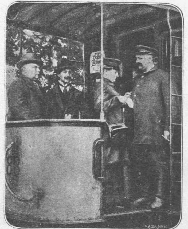
Αἱ ΓΕΡΜΑΝΙΔΕΣ.—Δὲν ἦτο δυνατόν νὰ ὑστερήσουν αἱ φημιζόμεναι διὰ τὴν νοικοκυρασὴν των Γερμανίδες. Μόλις ἐτρεξαν οἱ ἄνδρες ἀπὸ τὰς σημαίας, αὗται ἐτρεξαν νὰ τοὺς ἀντικαταστήσουν εἰς τὰ καταστήματα, εἰς τοὺς σιδηροδρόμους, εἰς τὰ τρέμ κ.λ.π.