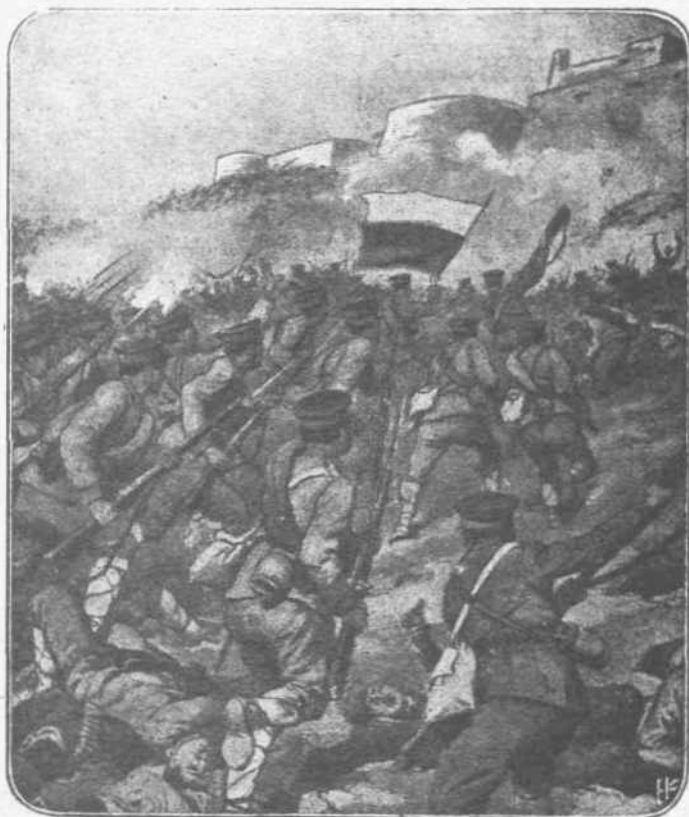
ΑΠΟ ΤΗΝ ΡΟΥΜΑΝΙΚΗΝ ΤΡΑΓΩΔΙΑΝ.—Υπό την διοίκησιν των Γερμανών, οι οποίοι τους εμπυζώνουν με την δύναμιν και την ισχυράν των θέλησιν, οι Βούλγαροι, άνέκτησαν τό ήθικόν τους, κατάνοησαν από τους άγώνας του 1913 και ιδιαιτητικώς προχωρούν εις τά Ρουμανικά έδάφη. Υπό την γενικήν άρχηγίαν του στρατάρχου Μάκενσεν τά Βουλγαρικά στρατεύματα τώρα προελαύνουν εις την Δοβρουτσάν, της οποίας ή ολοκληρωτική κατάληψις συνετελέσθη σχεδόν.