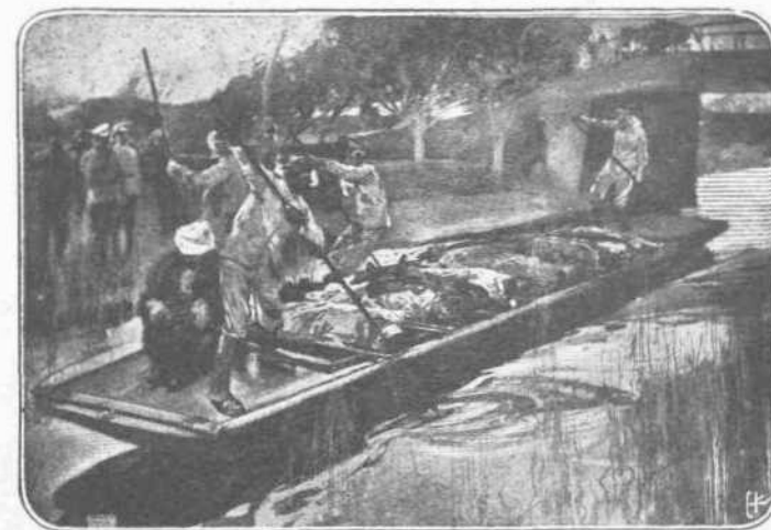
ΑΠΟ ΤΗΝ ΤΡΑΓΩΔΙΑΝ ΤΗΣ ΡΟΥΜΑΝΙΑΣ.—'Αφού εξαθάρισαν τό έδαφος της Δοβρουτσάς οι Βούλγαροι από πάντα κίνδυνον, τώρα μεταφέρουν διά των ποταμών της Ρουμανίας τρόφιμα εις τον στρατόν τους, δια προερχόμενα από την Ρουμανικήν γήν, ή οποία τά παρέχει άφθονα.