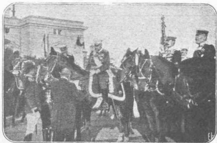
Η ΠΤΩΣΙΣ ΤΟΥ ΒΟΥΚΟΥΡΕΣΤΙΟΥ.—Η πτώσις του Βουκουρεστίου επανηγυρίσθη εις την Βουλγαρικήν πρωτεύουσιν με λαμπράν τελετήν, εκιοφραγισθείσαν με παρελάσιν του στρατού προ του Βασιλέως Φερδινάνδου. Ποία διαφορά μεταξύ της Βουλγαρίας του 13 και της σημερινής! 'Αλλ' ή Βουλγαρία δεν είχε τό άτύχημα, βλέπετε, να έχη ένα Βενιζέλον!