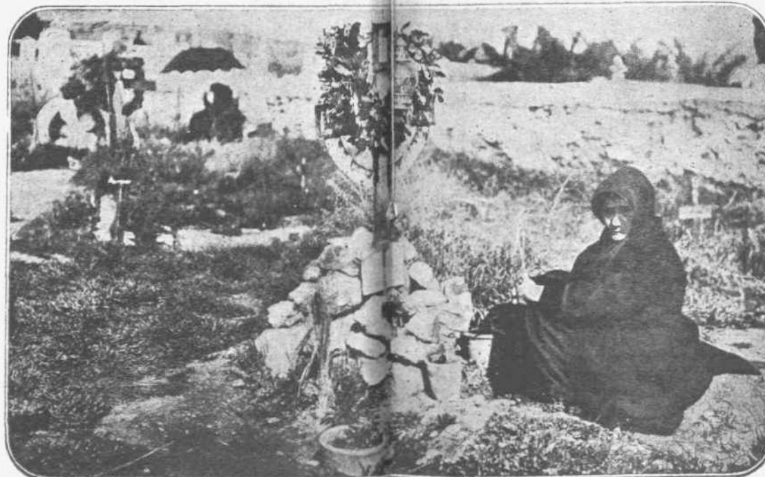
ΕΙΣ ΤΟΝ ΤΑΦΟΝ ΤΟΥ ΓΕΝΝΑΙΟΥ.—Εις τον τάφον του γενναίου, που προσέφερε την ζωήν του διά την τιμήν και την δόξαν της πατρίδος κατά την ώραιάν χειρωνακίαν της φυλής την 18ην Οκτωβρίου, ή μητέρα καταθέτει ένα δάκρυ λυπής μαζί με μία φτωχική κανδήλα και μία γλαστρούλα με λουλούδια, διά την έσώλειαν του παλημαριού δάκρυ, που αποτελεί όμως έν ταύτη και έκφρασιν εύγνωμοσύνης εκ μέρος της άλλης μητέρας, της πατρίδος.