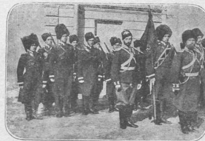
ΟΙ ΕΚΑΕΚΤΟΙ.—Κοζάκοι από τούς άποτελούντας τό έλεκτόν σάμα τών Κοζάκων του Ντόν, του όμωνύμου ποταμού, διακρίθόντες διά τήν γενναϊότητά των εις όλας τάς μάχας εις τάς όποιάς έλαβον μέρος.