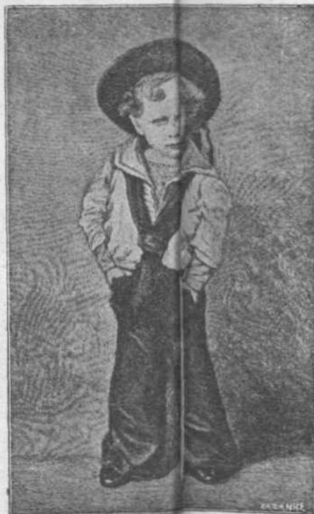
ΑΠΟ ΠΑΪΔΙ.—'Από μικρό παιδί, όπως φαίνεται εις τήν άνωτίκων εικόνα, ό Κάιζερ έφωσεν τό άτίθασον του χαρακτήρος του και έδειχνε νά γίνη άμα μεγαλώσων.