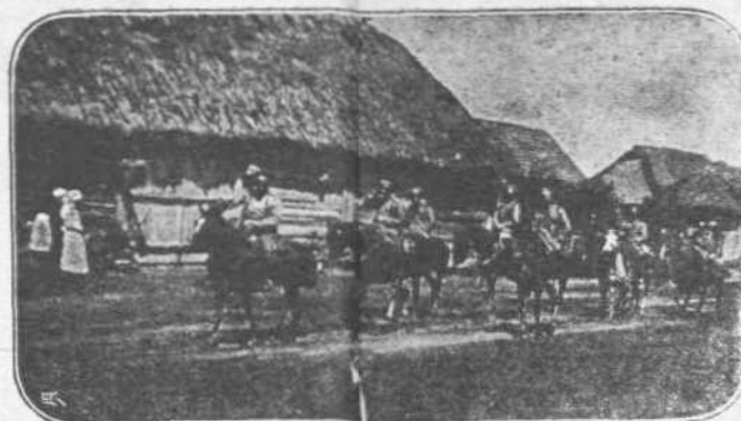
ΕΙΣ ΤΗΝ ΓΑΛΙΚΙΑΝ.—Πρωτοκορμιά Ρωσικού Ιππικού, εισερχομένη εις ένα από τά νεωστί καταληφθέντα χωρία, κατόπιν τής όμητικής προελάσεως του Ρωσικού στρατού.