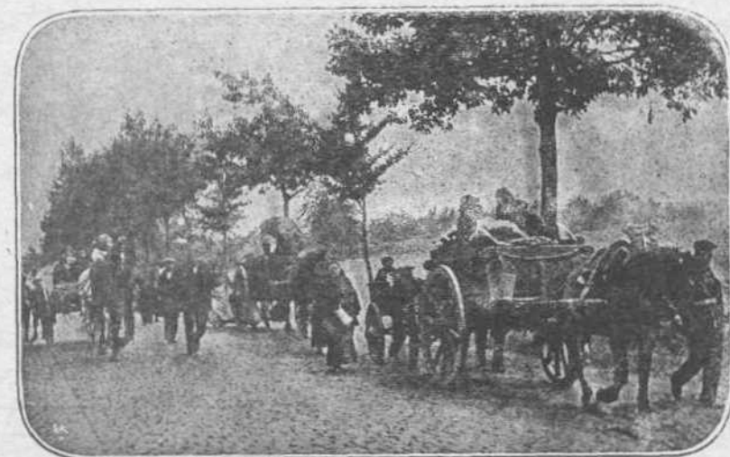
ΤΑ ΘΥΜΑΤΑ.—'Από τήν άρχήν του πολέμου οι δυστυχισμένοι κάτοικοι τής Γαλικίας έφορτίζουν τά πάνδενα αναγκάζόμενοι με τάς συχνάς καταλήψεις και άνακαταλήψεις τών χωριών των νά μετακομούν άνα' έδω και άνα' έκει.