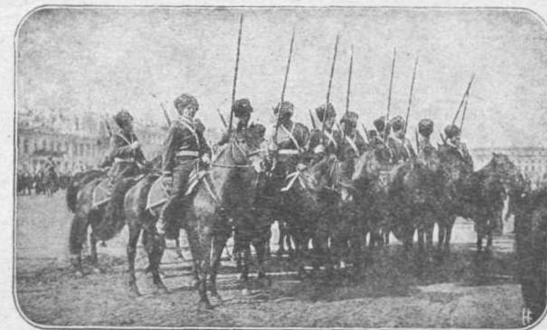
ΟΙ ΚΟΖΑΚΟΙ.—Θαυματουργούν κάλιν εις τήν Γαλικίαν οι περίφημοι Ρώσοι Ιππείς, οι Κοζάκοι, οτινις με τόν περίφημον στρατηγόν των, τόν επίσης Κοζάκον Ρένεκαμπφ, κατανατούν σάν θυελλικόν σάμα.