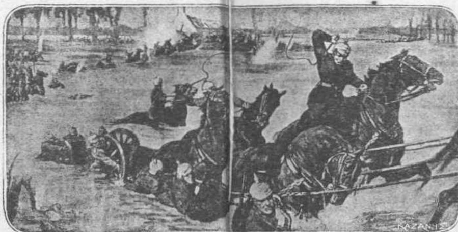
ΕΙΣ ΤΟ ΥΖΕΡ.—Εις τό 'Υζερ τό Γερμανικόν κυρολικόν εις μίαν από τάς τελευταίας θυελλώδεις προελάσεις τον κατά τών 'Αγγλων, αποκλισηφούνται όλα τά στοιχεία τής φυσικης.