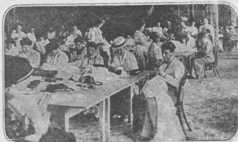
ΔΙΑ ΤΟΥΣ ΜΑΧΗΤΑΣ.—'Από τής άρχής του πολέμου ή Βασίλισσα τής Βουσερίας Μαρία Φερδινάνδισσα ίδρυσεν εις τό Μόναχον εργαστήριον άπορροούτων διά τούς πολεμούντας Βουσερίους και έπό τήν έκβλεψίν τής έξοκολούσας νά φηράσθαι θανράσια.