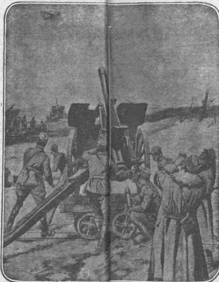
ΤΑ ΑΕΡΟΠΛΑΝΑ. — Τὰ ἀεροπλάνα, ἢ ἀεροβόλες αὐτῆς μηχανῆς, δὲν ἀφίχθουν ἐνκαιρίαν νὰ παρέλθῃ χωρὶς νὰ σκοπίσωσιν ἀπὸ τὰ ὕψη εἰς τὰ μαχομένα στρατοπέδα τὸν τροχὸν καὶ τὴν τροχίαν. Εἰς τὸ Ἰταλικὸν μέτωπον ἰδίως οἱ Αὐστριακοὶ ἔχουν τρελλάνει τοὺς Ἰταλούς μετὰ συχνὰς τῶν δι' ἀεροπλάνων αἰφνιδιστικῆς ἐπιθέσεις.