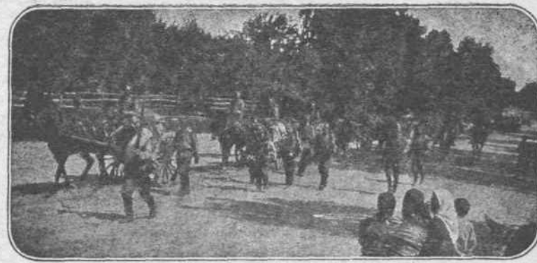
ΑΙ ΜΑΧΑΙ ΤΗΣ ΓΑΛΙΚΙΑΣ. — Μία ἀπὸ τὰς μεγαλειότατας δυσχερείας, τὰς ὁποίας συναντοῦσιν οἱ Ρῶσοι εἰς τὴν προέλασίν των, εἶναι καὶ αἱ μεγάλαι δυσκολίαι τοῦ ἐπιαιτισμοῦ, διότι ἕνεκα τῆς διαφορᾶς τῶν Ρωσικῶν οἰδηροδρομικῶν γραμμῶν, ἀναγκάζονται νὰ μεταφέρουν τὰ τροφίμα μετὰ ἀτέρμονας συνοδείας μεταγωγικῶν.