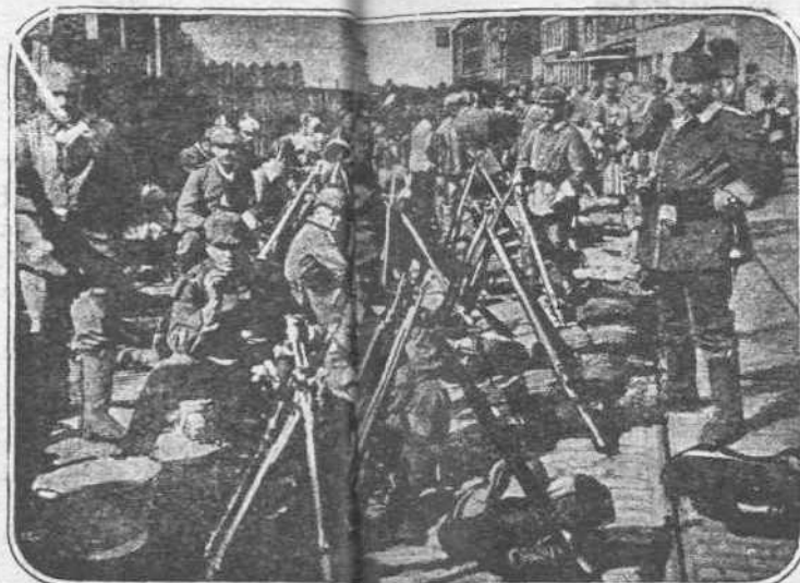
ΕΙΣ ΤΗΝ ΒΑΛΚΑΝΙΚΗΝ. — Εἰς ὁποῖαδήποτε πόλιν καὶ ἐν ἑπάγουσιν οἱ Γερμανοὶ στρατοπεδεύουν εἰς τοὺς δρόμους, εἶναι πάντοτε ἑτοιμοὶ ν' ἀρπῶσιν τὰ δῶλα. Εἰς τὴν Σόφειαν, δεῖν ἀπὸ πόλιν καὶ τῶρα εἰσάγονται Γερμανικὰ οὐκίσματα, οἱ στρατιῶται τῶν εἰσεστρατοπεδευμένων τοὺς δρόμους τῆς Βουλγαρικῆς προετοιμασίας.