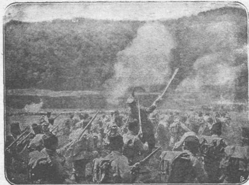
ΑΙ ΜΑΧΑΙ ΤΗΣ ΒΑΛΚΑΝΙΚΗΣ. — Οἱ περίφημοι Τούρκοι τῶν Γάλλων, οἱ ὁποῖοι διεκρήθησαν εἰς πολλὰς μάχας, μεταφερθέντες καὶ εἰς τὴν Βαλκανικὴν καὶ ἐβρισκόμενοι εἰς τὰ Ἑλληνοβουλγαρικὰ σύνορα, ἐπιχειροῦσιν συχνὰ αἰφνιδιστικὰς ἐπιθέσεις κατὰ τῶν Βουλγάρων, εἰς τὰς τάξεις τῶν ὁποίων προξενοῦσιν μεγάλην θραύσιν.