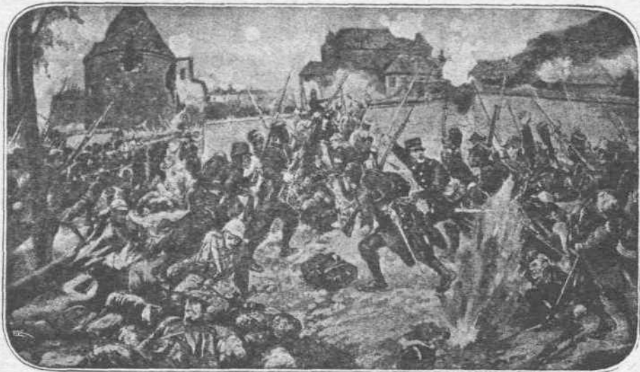
ΑΙ ΜΑΧΑΙ ΤΟΥ ΒΕΡΝΤΕΝ. — Εις τὸ μέτωπον τοῦ Βερντέν αἱ μάχαι ἐπανελήφθησαν καὶ πάλιν μετὰ μεγάλην σφοδρότητα. Οἱ Γερμανοὶ προελαύνουν πρὸς τὸ θρυλικὸν φρούριον, καταλαμβάνοντες τὰς γαλλικὰς ἐπιχειρήσεις. Ἀλλὰ καὶ οἱ Γάλλοι ὁμῶς μάχονται γενναίως, ἐγκαταλείποντες τὸ ἔδαφος τῶν σιδηρῶν πρὸς σιδηρῶν.