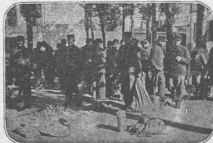
ΕΙΣ ΤΗΝ ΘΕΣΣΑΛΟΝΙΚΗΝ. — Εἰς ἕνα ἄρσενον Ἰσραηλιτικῶν Σχολικῶν μέγαρον εἶχε ἐγκαταστήσει τὸ Στρατηγεῖόν του ὁ στρατηγὸς Σαρῆν. Ὁλόκληρον διαμέρισμα τοῦ κτιρίου αὐτοῦ εἶχε μεταβληθῆ εἰς μαγειρεῖον καὶ οἱ ὀδονόμοι τῶν διαφόρων ἀξιωματικῶν τοῦ Ἐπιτελείου παρασκευάζουν εἰς τὴν αὐλὴν τὸ γεῦμα.