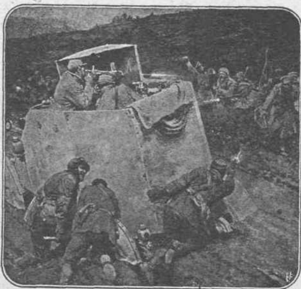
ΜΙΑ ΤΡΑΓΙΚΗ ΣΤΙΓΜΗ. — Εις τὰς ἀνιχνεύσεις τῶν οἱ Γάλλοι μεταχειρίζονται, δεῖν τὸ ἐπιτρέψει τὸ ἔδαφος, αὐτοκίνητα τεθωρακισμένα. Μίαν στιγμήν ποῦ τὸ αὐτοκίνητον διέβηεν ἕνα λυσσοῦδη καὶ ἐλευνὸν δρόμον, ἐσκασεν ὁ ἕνας τροχός. Οἱ ἐπιβαίνοντες ἐπεύσαν νὰ τὸν ἐπιδιορθώσωσιν. Ἀλλὰ κατὰ κακὴν συμπτῶσιν ἐκείνην τὴν στιγμήν Γερμανικὸν ἀπόσκαμα, κρατῶμενον ἐκεῖ κάπου, ἐξώρμησεν ἐναντίον του. Τὸ μικρὸν κινητὸν φρούριον ἀντέταξε λυσσοῦδη ἀγῶνα, ἀλλ' ἐπὶ τέλος παρεδόθη.