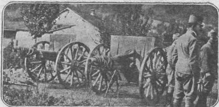
ΠΡΟΕΤΟΙΜΑΣΙΑΙ. — Εις τὸ Κραγιόνεβατς τῆς Σερβίας οἱ Αὐστριακοὶ ἔχουν συγκεντρώσει διὰ τὰ λάφυρα, τὰ ὁποῖα ἐγκατέλειπον εἰς τὰς χεῖρας των, μαζί με τὴν ἐγκατέλειπον τῆς πατρίδος των, οἱ Σέρβοι. Ἀπὸ τὰ λάφυρα αὐτὰ ἐξωρίζουν τῶρα τὰ κανόνια, λάφυρα καὶ αὐτὰ τῶν Σέρβων κατὰ τὸν Βαλκανικὸν πόλεμον, τὰ ὁποῖα θὰ χρησιμοποιήσωσιν διὰ νὰ σκοπίσωσιν τὸ πῦρ καὶ τὸν ὀλεθρὸν, ποῖός ξερεῖ ποῦ...