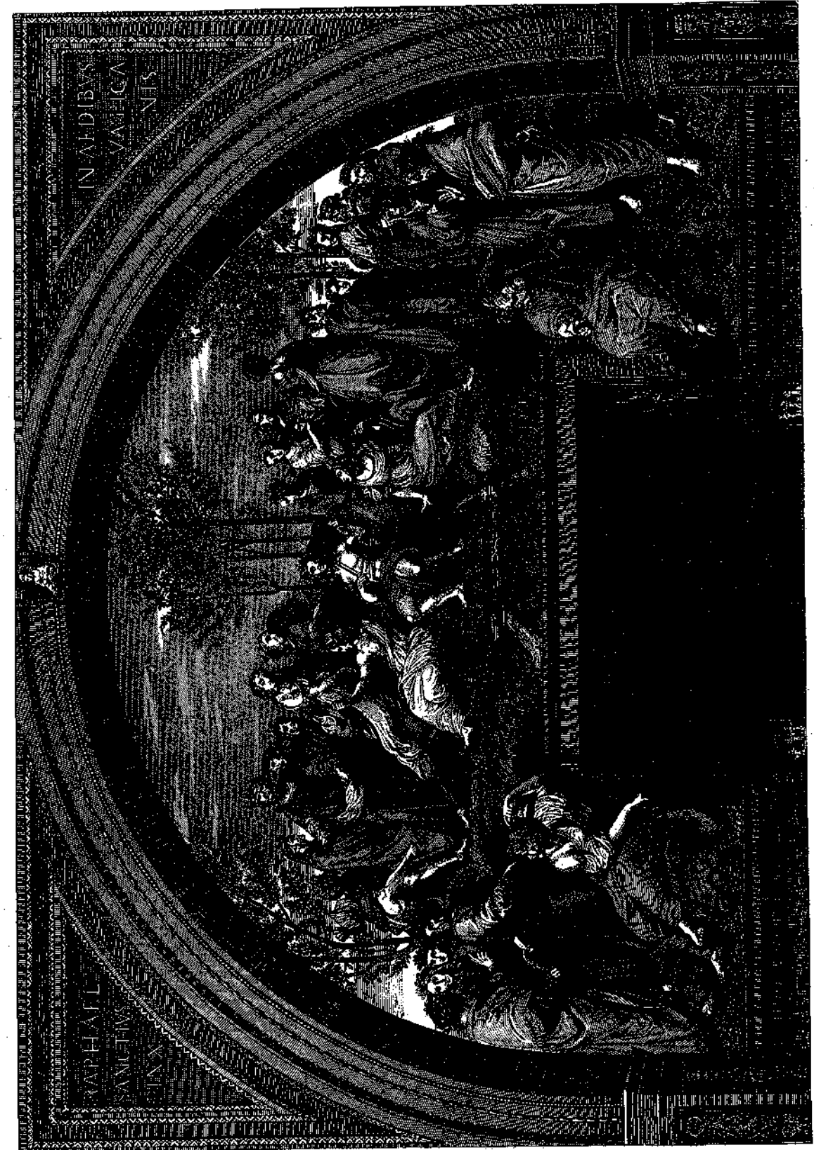
Κατὰ τὸ πρωτότυπον εἶδος ἐν τῷ Βασιλικῷ εἰδῶσι τοῦ Ραφαῆλ.