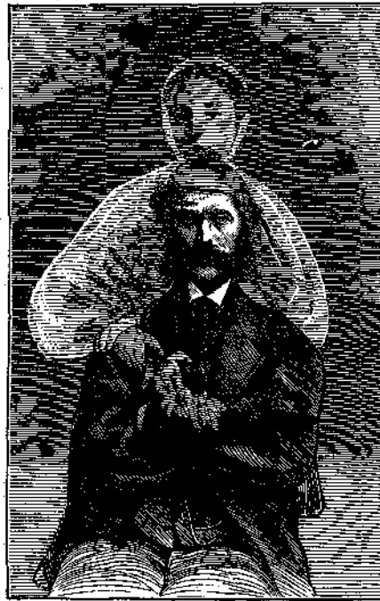
Πνευματιστικὴ φωτογραφία (ἴδε σελ. 215).

Ὅλιγον ἀνωτέρω ἀνέφερα ὡς ἐν παρόδῳ ἄνθρωπον ἐπὶ τῆς σελήνης πλανώμενον. Αὐτὸ δὲν εἶνε ἀληθές, ἐπιθυμῶ δὲ τώρα ν' ἀπαλλάξω τὴν συνειδησίν μου φανερὰ ὁμολογῶν, ὅτι κυρίως οὐδεὶς ἄνθρωπος ὑπάρχει εἰς τὴν σελήνην. Τὴν διαβεβαίωσιν ταύτην πρέπει νὰ ἐκφράσω μετὰ πάσης θετικότητος, ἐπειδὴ ἐγὼ αὐτὸς πολλάκις εὐρέθην εἰς τὴν σελήνην καὶ ἰδίως ὀφθαλμοῖς ἠδυνήθην περὶ τούτου νὰ πεισθῶ. Καὶ ναί μὲν ἐπὶ τοῦ παρόντος μίαν μόνον γραμμὴν συγκοινωνίας ὑπάρχει μετὰ τῆς γῆς καὶ τῆς σελήνης, μετ' ἄλλους λόγους ἢ διὰ τοῦ τηλεσκοπίου ὀπτικῆ γραμμῆς, ἀλλ' ὅμως καὶ αὕτη ἤρκεσεν, ἵνα μοι παράσχῃ πολλάκις τὴν εὐκαιρίαν