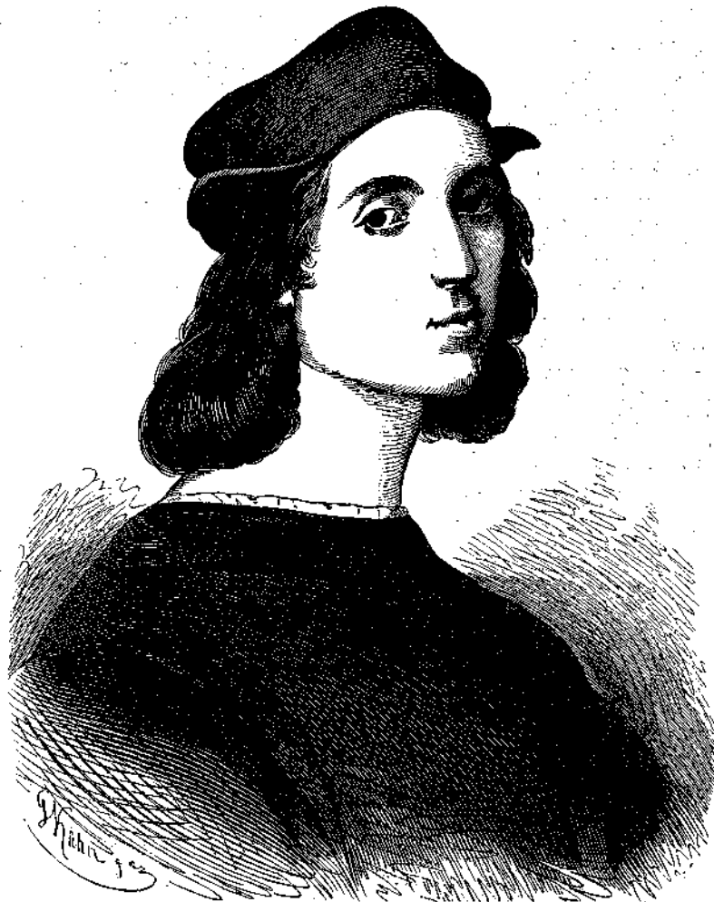
Ἐγεννήθη τῆ 6. Ἀπριλίου 1483, † τῆ αὐτῆς ἡμέρας τοῦ 1520.

*) Τὰ περιφημότερα ἀρι- στοურγήματα τοῦ δαιμονίου χρι- στιανοῦ ζωγράφου ἐδημοσιεύθη- σαν ἤδη διὰ τῆς Κλειῶς, ἀνα- τυπούσης σήμερον μετὰ τοῦ Παρασσού καὶ τὸ ἔξοχον αὐ- τοῦ ἀριστοῦργημα, τὴν Πανα- γίαν τοῦ Ἁγίου Σίξτου. Σύν- τομοὶ τινες βιογραφικαὶ σημειώ- σεις ἐφάνησαν ἡμῖν ἀπαραίτητοι σὺν τῇ παραδέσει τῆς ἰδιογρά- φου τοῦ μεγάλου τεχνίτου εἰ- κόνας.