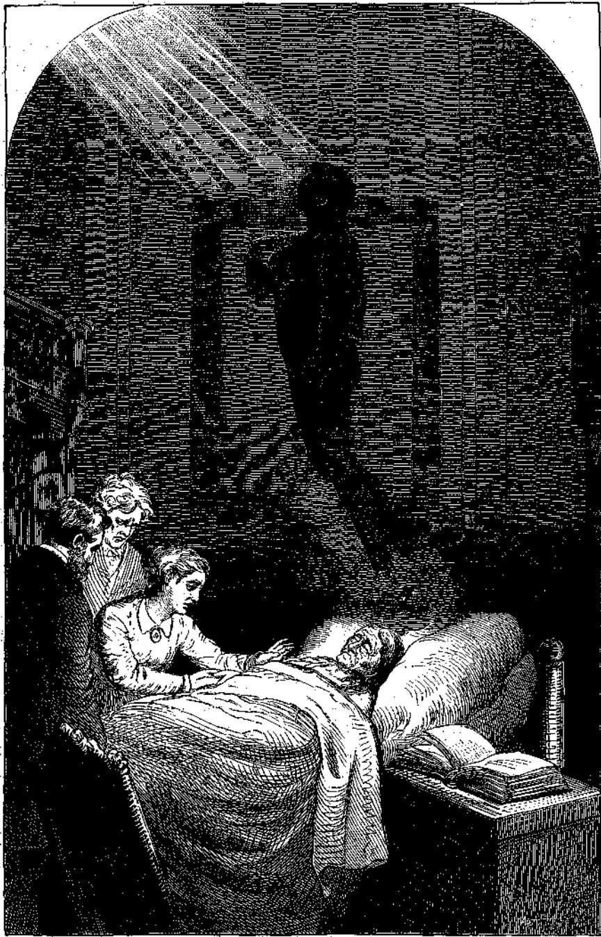
Ἡ ΜΕΤΑ ΘΑΝΑΤΟΝ ΑΝΑΓΕΝΝΗΣΙΣ ΤΗΣ ΨΥΧΗΣ.

Κατά τὴν πρώτην αὐτῆς εἰς τὸ Δημόσιον ἐμφάνισιν ἡ Κλειώ ἔσχε τὴν τιμὴν νὰ φιλοξενήσῃ σπουδαίαν περὶ Πνευματισμοῦ πραγματείαν, μετὰ χάριτος ἅμα καὶ ἐμβριθείας ὑπὸ τοῦ ἡμετέρου κυρίου Α. Ρ. Ραγκαβῆ γεγραμμένην. Παράλληλως πρὸς τὰ τότε συζητηθέντα ἐπιχειροῦ νὰ συναφομοιώσω ὀλίγας τινὰς σημειώσεις μου περὶ παραπλησίου τινὸς θέματος, προωρισμένου συγχρόνως νὰ χρησιμεύσῃ εἰς ἐρμηνείαν τῶν δύο παρατεθειμένων εἰκόνων, ὧν ἡ πρώτη αὐτῆ παρίστησι τὴν κατὰ τὸν θάνατον ἀναγέννησιν τῆς ψυχῆς συμφώνως πρὸς τὴν θεωρίαν τοῦ γνωστοῦ Ἀμερικανοῦ ἰατροῦ Δάβρις. Κατὰ ταύτην πρεσβύτης τις ἀποδνήσκει, ἡ δὲ ψυχὴ τῆς ἐν μορφῇ ὠραίας νεαρᾶς κόρης ἀφίπταται εἰς τὸν αἰθέρα ἀόρατος καὶ ἄλλος διὰ τοὺς περικυκλοῦντας τὸ ἀποδνήσκον σῶμα οικείου.