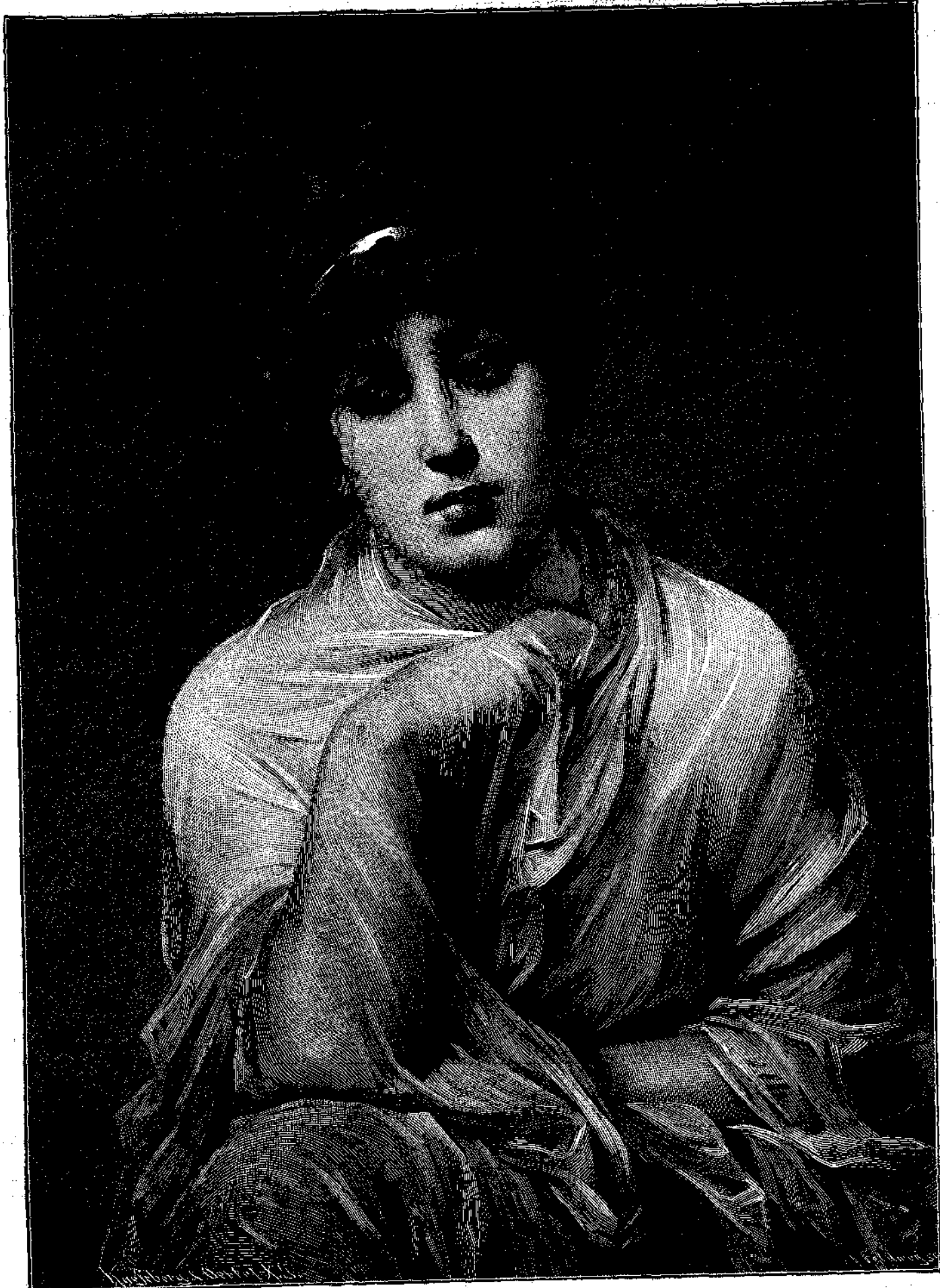
Ἡ ΠΕΜΒΑΖΟΥΣΑ κατὰ τὸ πρωτότυπον εἰκόνας τοῦ Σίχελ.

Μόλις ἤρχισε νὰ ὑποφώσῃ τὸ λυκαυγὲς τῆς ἐπιούσης ἡμέρας ὁ Κλεομένης ἐθύπνησεν εἰς τὸ πλευρὸν τῆς Τελεσίλλης καὶ ἐστρεψε πρὸς αὐτὴν τὰ βλέμματά του. Εἰς τὴν θέαν αὐτῆς ἐξέβαλε φοβερὰν κραυγὴν καὶ ἀνεπήδησε τῆς κλίνης. Ἡ Τελέσιλλα ἦτο νεκρά. Ἐκείτω ὄχρᾶ, ἴσχυος με ἀνοικτούς ὀφθαλμούς καὶ χεῖρα σπαρμωδικῶς συνεσταλμένα. Ἐκ τοῦ στόματός της ἔρρε κρουνὸς αἵματος χυνόμενος ὑπὲρ τὴν σιαγόνα καὶ τὴν τρα-