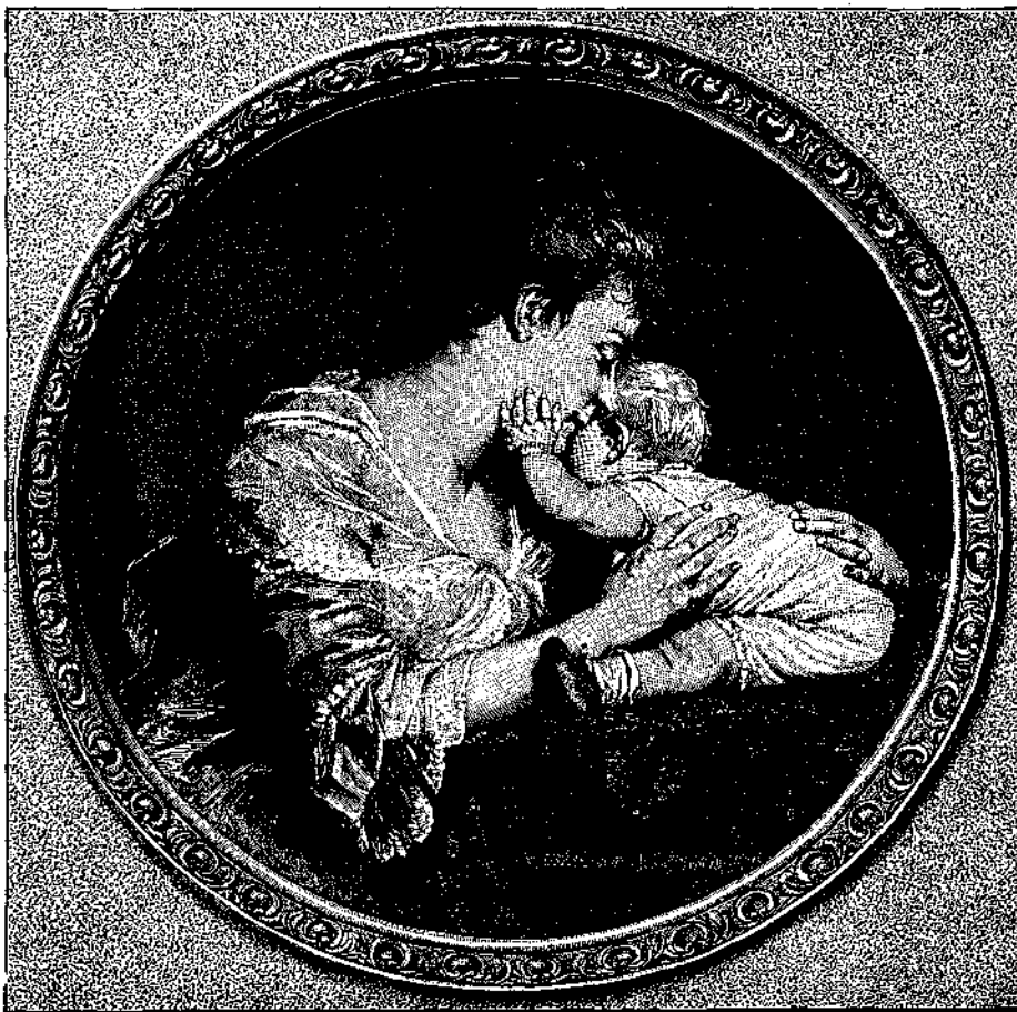
ΕΡΩΣ ΠΡΩΤΟΓΕΝΗΣ, Ἐλαιογραφία Εδγ. Klinsch.

συνήθων ἐνυπνίων, εὐρίσκομεν τὸ αὐτὸ γινώρισμα τῆς συμπικνώσεως τῶν παραστάσεων εἰς ὄρισμένον τι εἶδος τῶν ἡμετέρων ἐνυπνίων, τὸ ὁποῖον δὲν εἶνε σπάνιον, καὶ ἐπειδὴ δύναται να προκληθῆ καὶ διὰ τεχνητῶν μέσων, εἶνε ἐκάστοτε προσιτὸν καὶ εἰς πᾶσαν πειραματικὴν παρατήρησιν. Δαρβίνος ὁ πρεσβύτερος ἔγραψεν ἤδη ἐν τῇ „Ζωονομία“ του, ὅτι ἐξωτερικαὶ ἐντυπώσεις, προξενούμεναι εἰς τὴν συνείδησιν τοῦ ὄνειρευομένου καὶ ἐν τῷ μεταξῷ ἀφυπνίζουσαι αὐτόν, δύνανται ν' ὀποβῶσιν ἀφορμὴ μακροῦ καὶ μεγάλης πλοκῆς ἔχοντος