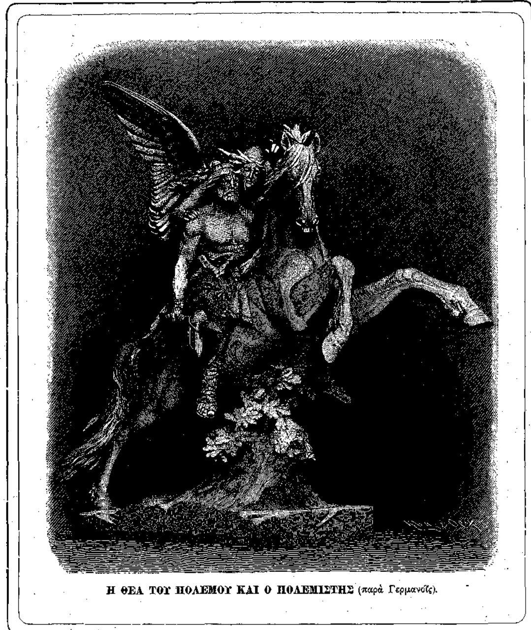
Ἡ ΘΕΑ ΤΟΥ ΠΟΛΕΜΟΥ ΚΑΙ Ο ΠΟΛΕΜΙΣΤΗΣ (παρὰ Γερμανός).

μιξίς τῶν διαφόρων σίτων, αὐτὸς ὅμως πρῶτος εἰσήγαγε καὶ τὰ κατάλληλα προφυλακτικὰ μέτρα, δι' ὧν καθίσταται δυνατὴ ἡ προμελετωμένη σύμμιξις. Ἄφ' οὗ ἐξέλεξε τὰ ἀνάλογα εἶδη, ἤρχισε τὸ πείραμα ἀποκόπτων τὴν κορυφὴν τοῦ κυρίου στάχυος, ἵτοι ἐκείνου δεξις εἶδει νὰ γονιμοποιηθῆ διὰ τῆς ἄχνης τῶν ἄλλων εἰδῶν. Οἱ πρῶτοι ἐκ τῆς συμμίξεως ταύτης παραγόμενοι κόκ-