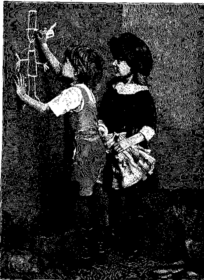
Ο ΜΙΚΡΟΣ ΡΑΦΑΗΛ.

Μεσμέρου καὶ τῶν πολυαριθμῶν αὐτοῦ μαθητῶν εἰς τοὺς διὰ τοῦ μαγνητισμοῦ θεραπευομένους καὶ ἄλλα τινὰ φαινόμενα, τῶν ὁποίων τὸ παράδοξον καὶ τὸ γόητρον τοῦ μυστηριώδους ἐκίνησαν τὴν γενικὴν προσοχὴν.