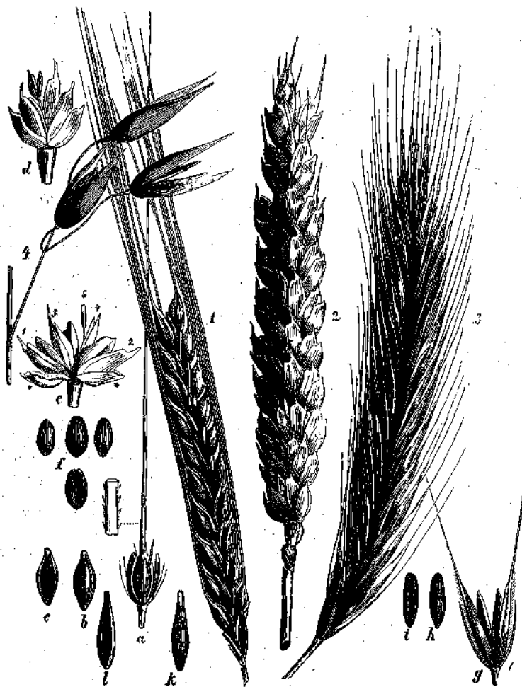
Οἱ τέσσαρες κυριώτεροι τροφῆς τοῦ ἀνθρώπου. 1, Σίτος καθ' ἡμέραν, α, μικρὸς στάχυς, παρ' αὐτὸν εἰς τερματῶν ἀνθός, β, ὁ κόκκος — 2, κοινὸς σίτος, γ, ὁ ἀπομιμηθὲν μῦθος τοῦ ἀνθρώπου, ἐπὶ τοῦ ἀνθρώπου τὰ 1, 2, 3, 4, 5 σημεῖοι τῶν καρπῶν, δ, κόκκος σίτου, — 3, κοινὴ σῆκαλις, ι, ἡ κόκκος αὐτῆς, — κοινὴ δυνάμη βρόμη, ιι, κ κόκκος αὐτῆς.

Τοὺς ἀστοὺς λοιπὸν ἐκείνους, οἱ ὅποιοι ἴσως μόνον ἐκ τῆς σχολῆς καὶ ἐξ ἀκοῆς γνωρίζουσι τὸν τρόπον τῆς καλλιεργείας τῶν σιτηρῶν, μέχρι δὲ τῆς σήμερον ἐλησιμόνησαν ἐντελῶς ὅσα κατὰ τὴν παιδικὴν ἡλικίαν των ἔμαθον, παρακαλοῦμεν νὰ παρατηρήσωσι τὴν σήμερον ἐνταῦθα παρατιθεμένην εἰκόνα. Τὰ καθ' ἕκαστα μέρη τῶν διαφόρων εἰδῶν τοῦ σίτου τόσοσιν ἀκριβῶς εἶνε ἐν αὐτῇ ἐξωγραφημένα, ὥστε περιττὴ ἀποβαίνει πᾶσα λεπτομερὴς περιγραφή. Μόνον περὶ τῶν ἐσωτερικῶν μερῶν τοῦ ἀνθους τῶν ἐνταῦθα ἀναφερομένων δημητριακῶν θέλομεν νὰ εἰπωμεν βραχέα τινά. Οἱ τρεῖς στήμονες καὶ ὁ κυρίως καρπὸς περιλείπονται ὡς ἐπὶ τὸ πλεῖστον ὑπὸ διπλῶν βαλβίδων ἢ γενεῶν, τῶν γενεῶν τοῦ κάλυκος καὶ τοῦ βλαστοῦ. Αἱ βαλβίδες αὐταὶ ἀνοίγονται μόνον ὅταν ὁ καρπὸς ἦνε καλὸς καὶ μετὰ τὴν γονιμοποίησιν ἀναφαίνονται ἐπὶ τοῦ στάχυος οἱ χλωροκίτρινοι στήμονες. Κατὰ παλαιὸν ἔθος συνειθίζομεν καὶ ἡμεῖς τὴν κατάστασιν ταύτην νὰ θεωρῶμεν ὡς τὴν ἀκμὴν τῶν δημητριακῶν καρπῶν, ἂν καὶ οὗτοι δύνανται ν' ἀν-