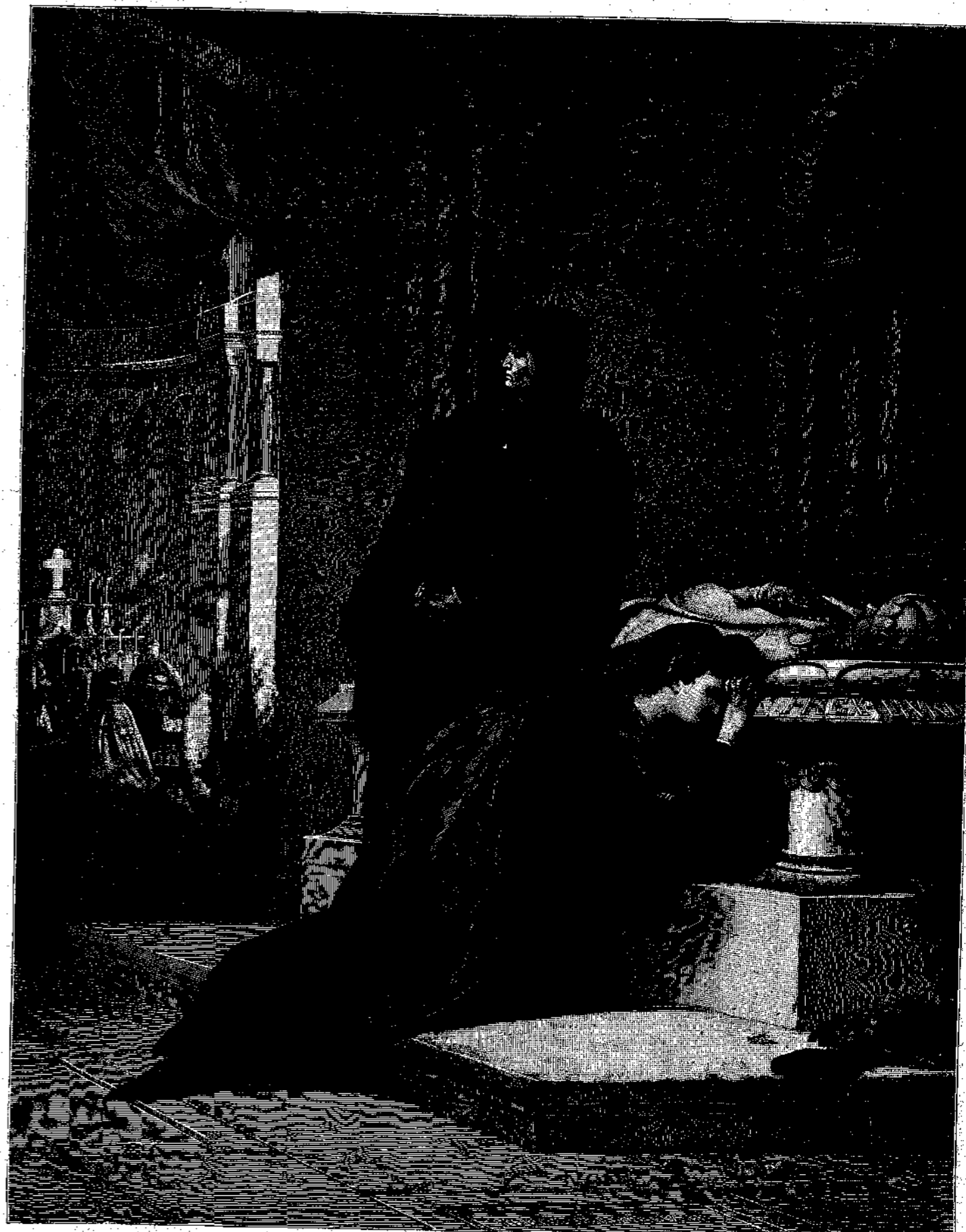
Η ΒΑΣΙΛΙΣΣΑ ΜΑΡΙΑ ΤΗΣ ΟΥΓΓΑΡΙΑΣ ΜΕΤΑ ΤΗΣ ΜΗΤΡΟΣ ΤΗΣ ΕΠΙ ΤΟΥ ΤΑΦΟΥ ΛΟΥΔΩΒΙΚΟΥ ΤΟΥ Α΄

Ἀλλὰ καὶ ἐν αὐταῖς ταῖς οἰκίαις, εἰς αὐτὰς δὲν ἠδύνατο νὰ εἰσχωρήσῃ τὸ βλέμμα τῶν διαβατῶν, τὴν αὐτὴν ἤσκει ἐπενέργειαν ἡ ἔκτατος τῆς ἡμέρας θερμότης. Ἐξαιρουμένων τῶν θεραπεινῶν καὶ τῶν δούλων, εἰς οὓς ἦν ἀνατεθειμένη ἡ διευθέτησις τῶν τοῦ οἴκου ἐν γένει καὶ οἵτινες περιφέροντο ἐν τοῖς μαγειρείοις, δὲν ἐβλεπέ τις ἄλλην τινα κίνησιν ἢ ἐργασίαν. Ὅλοι ἐκάθηντο ἢ ἐκοίτοντο εἰς τεχνητῶς σκιασθέντα δωμάτια καὶ ἀνεπαύοντο, ὡς ἐπὶ τὸ πλεῖστον ὄλιως ἀργοί, ἐν μέρει δὲ ἀσχολούμενοι εἰς ἀσήμαντα ἐργόχειρα. Αἱ σημαντικώτεραι δέσποιναί καὶ παρθέναι ἦσαν ἐξηπλωμένοι μετὰ τὰς ἐλαφράς ἐκείνας ἐκ τῆς νήσου Κῶ ἐσθητάς των ἐπὶ ἀνακλιντῶν, καὶ παρ' αὐτὰ ἐκάθηντο κατὰ γῆς δούλαι, αἵτινες διὰ ταωνείων πτερῶν διαρριπίζουσαι ἐδρόσιζον τὸν ἀέρα.