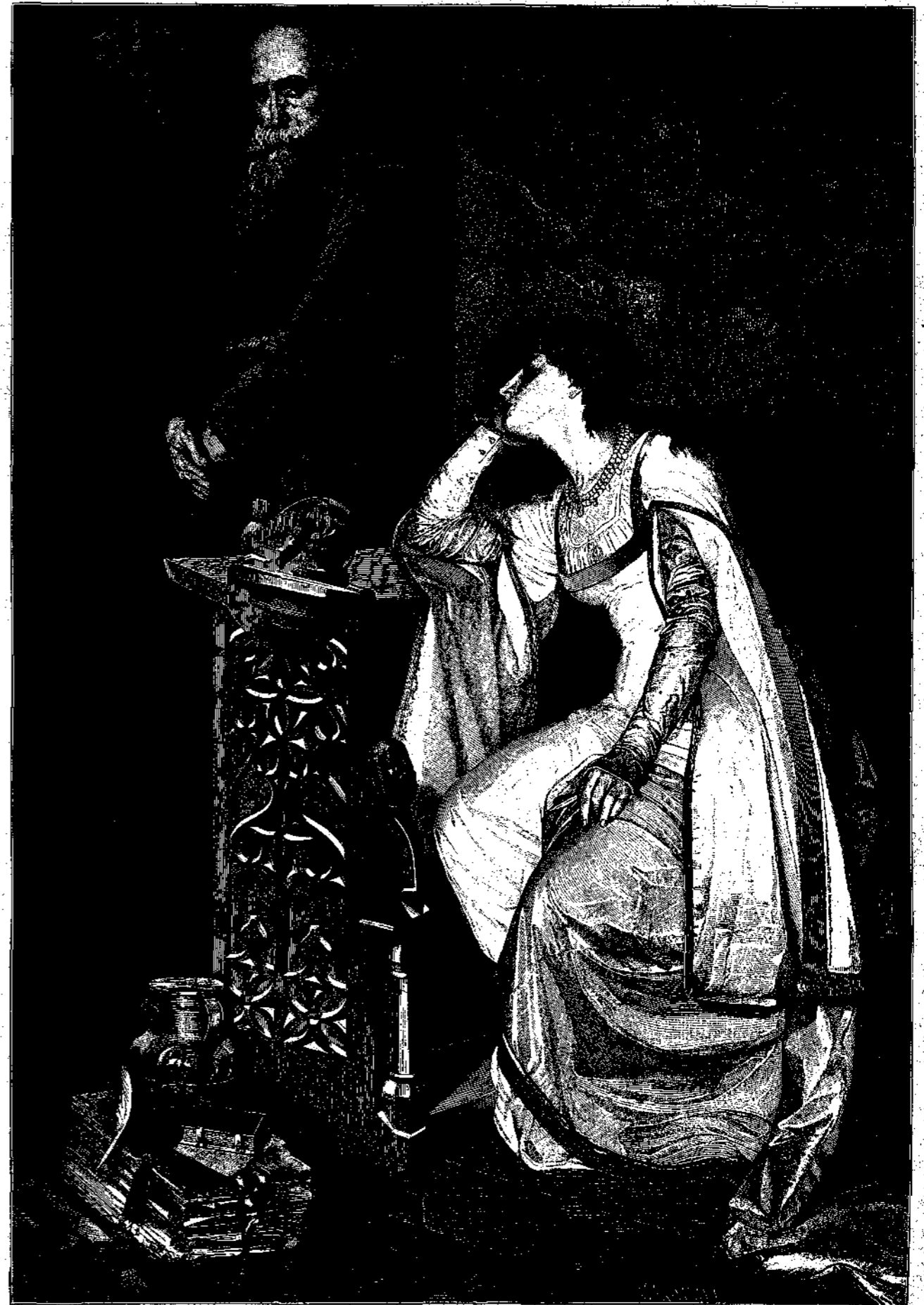
Ο ΛΑΥΡΕΝΤΙΟΣ ΚΑΙ Η ΙΟΥΛΙΕΤΤΑ.