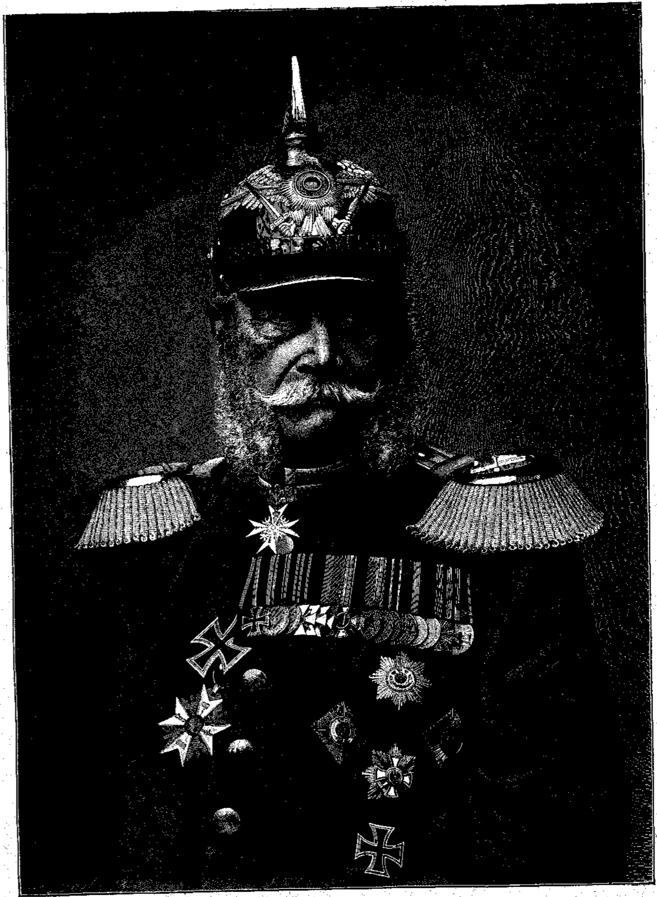
† ΓΟΥΛΙΕΛΜΟΣ Α'.