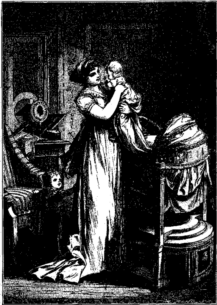
Ἡ ΒΑΣΙΛΙΣΣΑ ΛΟΥΙΖΑ ΠΑΡΑ ΤΟ ΛΙΚΝΟΝ ΤΟΥ ΠΡΙΓΚΙΠΟΣ ΓΟΥΛΙΕΛΜΟΥ. Εἰκὼν ὑπὸ Παύλου Τοῦμαν.

θείσας βουλὰς τοῦ ἐξωτερικοῦ, εἶπε: „Δὲν γνωρίζω, εἰν δύναμαι νὰ καταχρασθῶ τὸν καιρὸν σας μόνον καὶ μόνον διὰ νὰ ὑποδείξω τὴν ἔκτασιν τῶν συμπαθειῶν, αἵτινες ἐξεπορεύθησαν ἐξ ὧθεν. Δὲν ὁμιλῶ περὶ τῶν Γερμανῶν ἐν τῷ ἐξωτερικῷ, τῶν ὁποίων αἱ κτήσεις αὐτὰ καθ' ἑαυτὰς δὲν εἶνε ἐκτεταμέναι. Ἀλλὰ καὶ ἀπὸ τὰς δυτικὰς ἀκτὰς τῆς Ἀφρικῆς καὶ τὰς νήσους τῆς καὶ ἐξ ὅλης τῆς ὑψηλοῦ, ἀνεξαιρέτως, ἐφθάσαν ἐκδηλώσεις λύπης ἐπὶ τῇ ἀπωλείᾳ, ἣν ὑπέστη τὸ γερμανικὸν κράτος: τὸ τελευταῖον τηλεγράφημα προήρχετο ἐκ τῶν ἐν Κορέᾳ γερμανῶν. Καὶ ἀπὸ ὅλης τῆς γωνίας τῆς γερμανικῆς ἐπικρατείας, ἀπὸ τὰς μικροτέρας νήσους καὶ κώμας, τὰς ὁποίας ἐπρεπε ν' ἀναζητήσω πρῶτον ἐπὶ τοῦ χάρτου — διότι, πιστεύω, οὐδεὶς εἶνε δυνατόν νὰ γινώσκῃ τόσον καλῶς τὴν γεωγραφίαν, ὥστε νὰ ἔχη ἀκριβῆ γνώσιν ὅλων τούτων τῶν χωρίων — προσέτι δὲ καὶ ἀπὸ αὐτοῦς τοῦς ἀντιποδᾶς ἤλθον ἐνδείξεις συμπαθείας. Ἡ ἱστορία δὲν ἀναφέρει δευτερον παράδειγμα μονάρχου, οὗ ὁ θάνατος ἐπροξένησε τόσον γενικὴν λύπην. Καὶ ἀπέθανον μὲν προηγουμένως καὶ ἄλλοι μεγάλοι ἄνδρες ἐν τῇ ἱστορίᾳ, καὶ ὅταν ἀπέθανε Ναπολέων ὁ Α', Πέτρος ὁ μέγας καὶ Λουδοβίκος ὁ ΙΔ', ὁ θάνατος αὐτῶν ἐθεωρήθη μέγα συμβεβηκός, τὸ νὰ σταλῶσιν ὄμως ἀπὸ τοῦς Ἀντιποδᾶς καὶ ἀπὸ τοῦς πλησιοχώρου λαοῦς