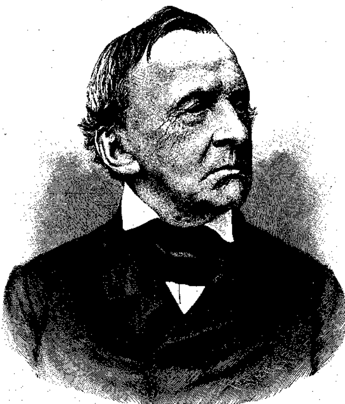
ΛΟΥΔΟΒΙΚΟΣ Α΄. Βασιλεὺς τῆς Βαυαρίας.

νεστέρων γειτόνων, οὔτε εἰς ἐξοχα διπλωματικὰ κατορθώματα: τὴν ἀθάνατον αὐτοῦ δόξαν ὀφείλει κατὰ πρώτιστον λόγον, ἢ μᾶλλον ἀποκλειστικῶς, εἰς τὸ ἀπέραντον ἐκεῖνο τοῦ καλοῦ καὶ τοῦ ὀραίου βασιλείου, ὅπερ ἐκράτησε μετὰ φλογεροῦ ἐνθουσιασμοῦ, εἰς τὸ ἀπειρον ἐκεῖνο κράτος τῶν ὀραίων τεχνῶν, ὅπερ κατέκτησε διὰ τῶν ἐνδόξων τῆς εἰρήνης νικῶν, ἃς ἤρατο ὁ ἐκλεκτὸς αὐτοῦ ἐκ τῶν ἐξοχωτάτων καλλιτεχνῶν συγκεκριημένος στρατός.