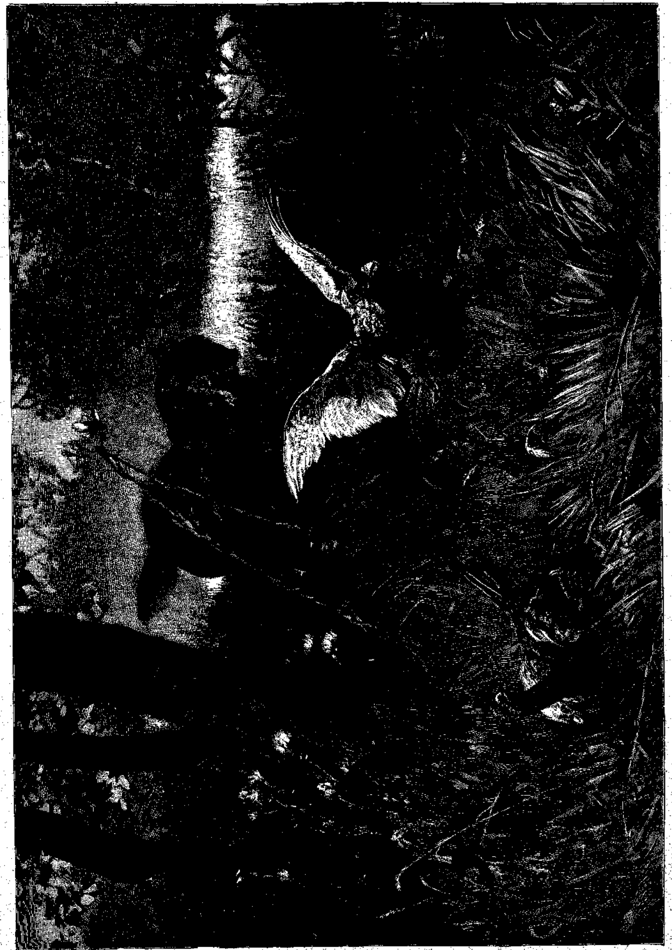
ΘΗΡΑ ΦΑΣΙΑΝΩΝ. Εκ του (πρ. Α. v. Madai).