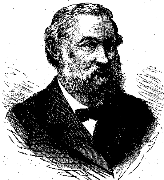
ΦΡΕΙΔΕΡΙΚΟΣ ΕΡΡΙΚΟΣ ΓΚΕΦΦΚΕΝ.

Πρῶτον καθηγητὴς ἐν τῷ πανεπιστημίῳ τοῦ Στρασβούργου.