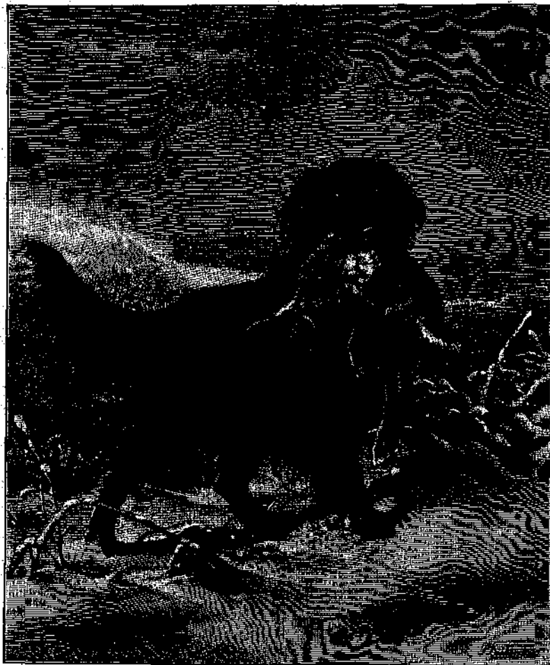
Η ΧΑΡΑ ΤΟΥ ΚΥΝΗΓΟΥ.

τῆς ὑπάρξεως τῆς γῆς ὡς πλανήτου. Ὡς πλανήτης ἡ γῆ ὑφίσταται πιθανῶς ἀπὸ 10 ἑκατομμυρίων ἐτῶν, μᾶλλον περισσοτέρων ἢ ὀλιγοτέρων. Ἀνθρώποι δὲ κατοικοῦσιν ἐπ' αὐτῆς κατὰ πᾶσαν πιθανότητα ἀπὸ 10,000 ἐτῶν, ἢ καὶ ὀλίγω περισσοτέρων, ὁ δὲ πολιτισμὸς ὑφίσταται ἐπ' αὐτῆς σχεδὸν ἀπὸ 5000 ἐτῶν. Ἐὰν ἀγγελὸς τις εἶχεν ἐπισκεφθῆ τὴν γῆν κατὰ ἴσα χρονικὰ διαστήματα ἐκ δεκαεπιχίλιων ἐτῶν, θὰ εἶχεν ἀναχωρήσῃ ἐκ τῆς γῆς πλέον ἢ χιλιάκις χωρὶς νὰ εἶρη ἐπ' αὐτῆς ἄνθρωπον. Κατ' ἀναλογία κρινόντες πρέπει νὰ παραδεχθῶμεν ὅτι τὸ αὐτὸ θὰ συνέβαινε καὶ εἰς ἐκεῖνον, ἔστις ἤθελεν ἐπιχειρήσῃ ὅμοιον ταξίδιον ἀπὸ πλανήτου εἰς πλανήτην καὶ ἀπὸ συστήματος εἰς σύστημα, μέχρις οὗ ἤθελεν ἐπισκεφθῆ πολλὰς χιλιάδας πλανητῶν. Καθ' ὅλα ταῦτα εἶνε πιθανὸν ὅτι σχετικῶς μικρότατος μόνον ἀριθμὸς πλανητῶν κατοικεῖται ὑπὸ λογικῶν ὄντων. Ἄν ὅμως ἀναλογισθῶμεν ὅτι ὁ ἀριθμὸς τῶν πλανητῶν ὑπερβαίνει τὰς ἑκατοντάδας ἑκατομμυρίων, βλέπομεν ὅτι ὁ ἀριθμὸς τῶν ὑπὸ λογικῶν ὄντων κατοικουμένων πλανητῶν, ἀπολύτως θεωρούμενος εἶναι ἴσως ἀρκετὰ μέγας. Πιθανὸν ὡσαύτως εἶνε ὅτι πολλοὶ ἐκ τῶν πλανητῶν τούτων κατοικοῦνται ὑπὸ ὄντων, ἅτινα ὑπερτεροῦσι μεγάλως τοῦ ἀνθρώπου ὑπὸ πνευματικῆν ἔποψιν.“ Οἱ λόγοι οὗτοι τοῦ σύφουστου Ἀμερικανοῦ ἀστρονόμου εἶναι πειστικώτατοι. Καὶ πῶς δύναται νὰ ἔχη ἄλλως τὸ πρᾶγμα! Διότι, ἂν παραδεχθῶμεν ὅτι ἐν