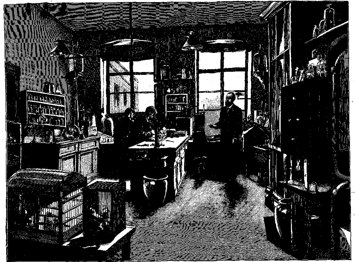
Ο ΚΩΧ ΕΝ Τῷ ΕΡΓΑΣΤΗΡΙῳ ΤΟΥ.