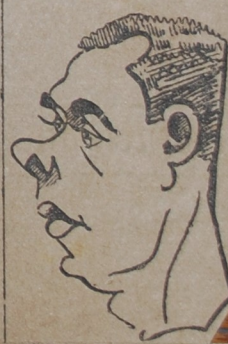
Ο θαυμάσιος Ούγγρος διοικητής Ρέμετς, φοβερός αντίπαλος τού Σούλα.

ότι λόγω τών έργασιών του άδυνατεί να μετασχη. Η δήλωσις αύτη ως ήτο έπομενον έτυχε μιας ύποδοχής όχι κολεακτικής διά τόν αθλητήν, δοθέντος μάλιστα ότι υπάρχει ή πληροφορία ότι μη διάγνυν καλήν ζώην φοβάται μήπως ήττηθ. Η ύστασις αύτη τού Λαμπρού, ή οποία και από άλλους πινάς ακολούθειται είναι ένδεικτική τού ότι τινες προπονούνται και έπισφρασονται διά τόν εθνικόν μας αθλητισμόν μόνο όταν προκείται περί ταξιδίου, ως ήτο έκείνο τού Ζάγκρεμπ και τού Λόσ-Αντζελες. Έν πάση πεποιτω-