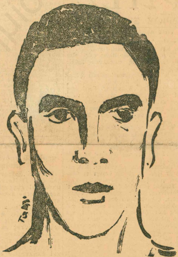
‘Ο θριαμβευτὴς τοῦ Μαραθωνίου Κυριακίδης

λγσεν ἕνα μεγαλειώδη θρίαμβον διὰ τὰ ἐλληνικὰ χρώματα.