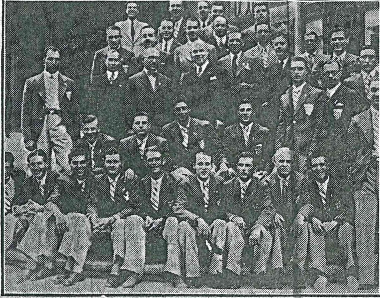
Ἡ ἑλληνικὴ ὁμάς φωτογραφουμένη εἰς τὴν οἰκίαν τοῦ ἐν Ζάγκρεμπ προξένου μας.