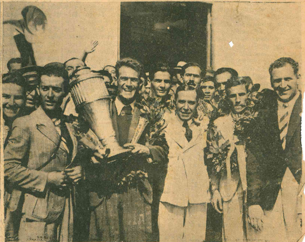
Οι φιλάθλοι ἐπεφύλασσον ἰδιαιτέρως ἐνθουσιώδη ὑποδοχὴν εἰς τοὺς ἐπιστρέψαντας ἀθλητάς μας. Ἀριστερὰ ὁ Κυριακίδης, δεξιὰ ὁ Μάντικας, φερόμενοι ἀπὸ τοῦ σταθμοῦ μέχρι τοῦ Δημαρχείου εἰς χεῖρας φανατικῶν φιλάθλων.