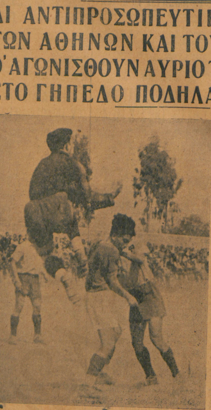
Μια θαυμαστική απόκριση του περιμετροφύλακα του 'Αστέρα κατά τον αγώνα πρωταθλήματος της ομάδος του με τον Φωστήρα.

ΜΕΤΑ ΜΑΚΡΑΝ ΑΝΑΜΟΝΗΝ ΑΙ ΑΝΤΙΠΡΟΣΩΠΕΥΤΙΚΑΙ ΟΜΑΔΕΣ ΤΩΝ ΑΘΗΝΩΝ ΚΑΙ ΤΟΥ ΠΕΙΡΑΪΩΣ Θ' ΑΓΩΝΙΣΘΟΥΝ ΑΥΡΙΟ Τ' ΑΠΟΓΕΥΜΑ ΣΤΟ ΓΗΠΕΔΟ ΠΟΔΗΛΑΤΟΔΡΟΜΙΩΝ