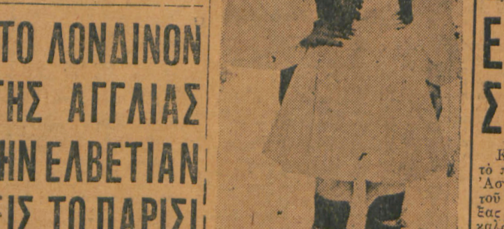
Ο αείωνος Σπύρος Λούης σὶ τὸν ἀγῶνα ἐπιχειρηματίας ἐκ Βαρκελώνης.

Ο ΑΤΡΟΜΗΤΟΣ ΣΗΜΕΡΟΣ ΜΕΤΑΒΑΙΝΕΙ ΕΙΣ ΤΗΝ ΛΕΙΒΑΔΙΑΝ