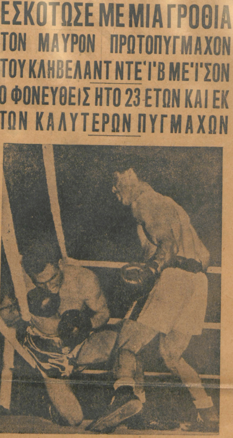
Νά καὶ ἓνα ἄλλο νόκ ἄουτ, ποὺ παρ' ὀλίγον νὰ εἶχε θανατηφόρον ἀποτέλεσμα. Πρὸς ἄφροντα καὶ πλεονεξομοὺς δημοσίους τὴν νίκην τοῦ Τζέσσιν (δελιά) μετ' ἅμω ἀπὸ ἐπὶ τοῦ Τζο Μάτσι στὸ Πιτιμπούργκ τῆς Αἰλινοῦρας. Ο ἑλεγενομας μετὰ τὸν ἀγῶνα μεταφέρθη στὸ νοσοκομεῖο ἀνεστέρας. Εἶχε πῶδαι δίασει ἀπὸ τὴν γροθίαν τοῦ Ρίντον. Ἐπὶ μίαν ἑβδομάδα ἐπάλασε μετ' ὅσον θάνατο. Τέλος χάρις στὴ γερὴ περιποιήθησαν διέφυγεν τὸν κίνδυνον. Μόλις ξανάβη στὴν ἀσπίρη τοῦ ἐξήλθε ἐπὶ τὸν ῥινά...

Ο ΝΟΚΑΟΥΤΙΣΤΑΣ ΤΖΟΣ ΜΑΤΣΙ ΕΣΚΟΤΩΣΕ ΜΕ ΜΙΑ ΓΡΟΘΙΑ ΤΟΝ ΜΑΥΡΟΝ ΠΡΩΤΟΠΥΓΜΑΧΟΝ ΤΟΥ ΚΛΗΒΕΛΑΝΤ ΝΤΕ'Ι'Β ΜΕ'Ι'ΣΟΝ Ο ΦΟΝΕΥΘΕΙΣ ΗΤΟ 23 ΕΤΩΝ ΚΑΙ ΕΚ ΤΩΝ ΚΑΛΥΤΕΡΩΝ ΠΥΓΜΑΧΩΝ