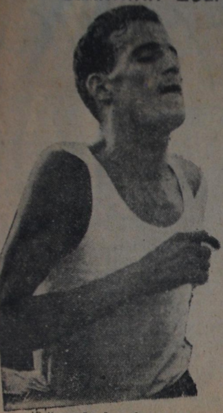
Ο Κυριακίδης όπως είναι σήμερα.

Ο Έλλην νικητής του Μα- ραθωνίου τής Βοστώνης