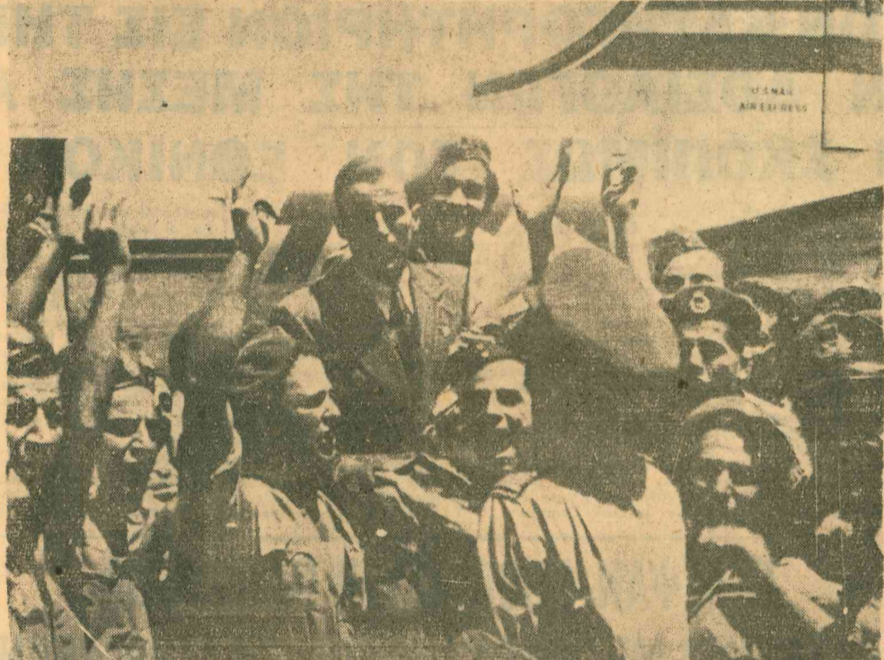
Ο Κυριακίδης κατά την άφιξίν του εις τό άεροδρόμιον.

Τέλος τόν ένδοξον νικητήν προσφωνεί ή κ. Ν. Λαυτιη έκ μένους της Ένώσεως Κυπρίων Αθηνών διά τών έξής ώριων λέγειών, ένώ τό πλήθος έξωκρούνησεν διά την ένωσην της Κύπρου με την μητέρα Ελλάδα. «Στέλιο Κυριακίδη! Άκούσ τώρα την φωνήν της πατρίδος σου. Υπερήφανος συμπατριώτ' σου προσέρχομαι να χαιρετισώ ένα Έλληνα Κύπριον νικητήν παγκοσμίων στίβων. Έρχομαι ως παιδί τών ίδιων στίβων που έγέννησαν και σένα, ως ή πρώτος όρασιαστής τών άθλητικών σου θριάμβων. Η Κύπρος τών Ακραίων, ή άθλογενήτρα πατρίδα σου, χαιρετά την ώραν αυτήν την Διγενή τών έλληνικών στίβων. Από τό Όλύμπια της Λεμεσού έρχεται φρονιτητή ή κοσμήγ ή ένός υπερηφάνου θριάμβου. Στέλιο: Παρουσίασε εις τόν διεθνή στίβον της Βοστώνης την πατρίδα σου με σημαίαν ελληνικήν. Τιμή σου. Έγγραφες τόν συγγινητικώτερον πρόλογον μίας όνευρεμένης αδριον. Με την πιο θαυραία συγκίνηση σου σφιγγουν τό χέρι αι Κυπριακαί όργανώσεις τών Αθηνών, συγκεντρωμέναι εδώ να σε χαιρετισούν. Καί έχομεντα μεταξύ με ή λην την Κύπρον, τί λέγομε; μεταξύ με όλο τό Έθνος, όπως ή σημαία αυτή Ιερών και άξιων σύμβολον πανελληνίου ένότητος, υπερήφανα ύψωθή και δοξασιμένη κυματισή εκεί όπου άπαιτη ή δικαιοσύνη, ή θέλησις τών έλευθερών άνθρώπων, ή πολιτική ήθική και ή πολιτική τιμή. Σήτω ή Ένωσις». «Ό Έλληνικός λαός τών Κυριακίδων και έμείς νωθήσιν στην έποχή βοσ τών άρχαίων. Την έσπέραν ή γήθη πρός τιμήν