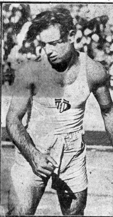
Ὁ Σύλλας εἰς μίαν τὴν προσπάθειαν