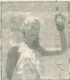
Η ΜΙΣΣ Δανία, μια από τις Ευρωπαϊκές καλλονές που λάμπρυναν με την ομορφιά τους το ΦΕΣΤΙΒΑΛ ΚΑΡΛΣΠΕΡΚ, χαιρέται και απολαμβάνει την νόστιμη Μπύρα ΚΑΡΛΣΠΕΡΚ και τον υπέροχο καιρό μας.