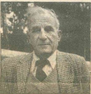
Επιδίδοντας προς τον θρυλικό Στέλιο Κυριακίδη τιμητική πλακέτα από μέρους του Φεστιβάλ, ο Έντιμος Υπουργός Δικαιοσύνης και Προεδρίας κ. Δημήτρης Λιβέρας, αφού προηγουμένως σε παλμώδη ομιλία του εξήρε το μεγαλείο του κατορθώματός του κατέληξε με τα πιο κάτω: «Σαν ένδειξη εκτίμησης και αγάπης των Κυπρίων προς το πρόσωπό σας και σαν δείγμα αναγνώρισης της τεράστιας προσφοράς σας στον κλασσικό αθλητισμό και των μοναδικών επιτευγμάτων σας στους δρόμους αντοχής, ιδιαίτερα στο Μαραθώνιο, που τίμησαν την Ελλάδα και την ιδιαίτερη σας πατρίδα Κύπρο στο διεθνές αθλητικό στίβο, σας επιδίδω τιμητική πλακέτα από μέρους της ΚΑΡΛΣΠΕΡΚ».

Σημαντικό μέρος των επίσημων εγκαινίων του 13ου ΦΕΣΤΙΒΑΛ ΚΑΡΛΣΠΕΡΚ απετέλεσε και η τιμητική διάκριση του ζωγράφου Αδαμάντιου Διαμάντη και του λόγιου Κυριάκου Χατζηγιάννου, τους οποίους προσφώνησε επιδίδοντας τιμητικές από μέρους της Οργανωτικής Επιτροπής της μεγάλης γιορτής πλακέτες ο Έντιμος Υπουργός Παιδείας κ. Ανδρέας Χριστοφίδης, που μεταξύ άλλων είπε και τα πιο κάτω: