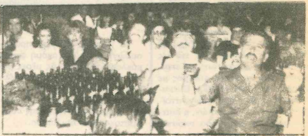
Η λαοθάλασσα του ΦΕΣΤΙΒΑΛ ΚΑΡΛΣΠΕΡΚ που ατού της είναι να μη ξεχωρίζει κοινωνικές τάξεις, απολαμβάνει με ανέμελο τρόπο τη χαρά, τη δροσιά, τη διασκέδαση που τις προσφέρει σχεδόν ανέξοδα η μεγαλύτερη αυτή γιορτή της Κύπρου, πάντα αφιερωμένη στην Κυπρία προσφυγοπούλα.

ΦΩΤΟΣ ΦΩΤΙΑΔΗΣ: «Να κάνουμε την Κύπρο Παγκόσμιο Πολιτιστικό Κέντρο. Η Κύπρος το δικαιούται ιστορικά και το μπορεί γεωγραφικά. Διαθέτει το ανθρώπινο δυναμικό και την πανάρχαια πολιτιστική παράδοση»