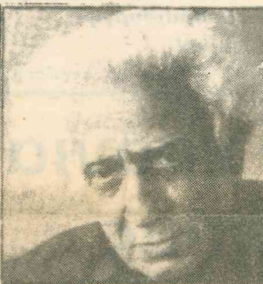
ΓΙΑ ΤΟΝ ΔΙΑΜΑΝΤΗ

... (continuation of the speech text from the previous block)