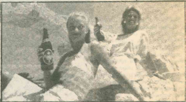
Οι Ευρωπαϊκές καλλονές ΜιςΣ Δανία και ΜιςΣ Ελβετία, επίσημες προσκεκλημένες του Φεστιβάλ, μαζί με την υπέροχη μπίρα ΚΑΡΛΣΠΕΡΚ συνθέτουν ένα θαυμάσιο τρίο ομορφιάς.