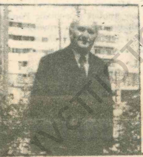
ΓΙΑ ΤΟΝ ΧΑΤΖΗ-ΓΙΑΝΝΟΥ

«Ο μεγάλος μάστορας της ζωγραφικής και ο μεγάλος δάσκαλος όλων μας σφράγισε καθοριστικά με την παρουσία του και το έργο του τα τελευταία 60 χρόνια στο νησί μας, ο εμπνευστής δυο γενιών και ο συντηρητής της λαϊκής παράδοσης του τόπου μας. Ο κατ' εξοχήν έμφρων και δημιουργός ανθρώπων τιμά όσους τον τιμούν και σπόμε μας τιμά όλους εμάς και εκείνους που είχαν την πρωτοβουλία αυτής της τελετής».