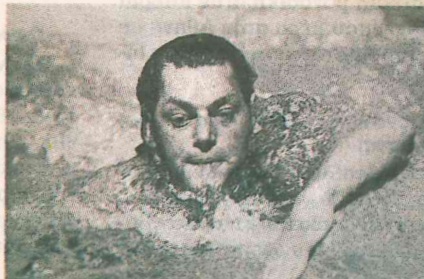
Ο 5 φορές χρυσός Ολυμπιονίκης Τζόνι Βαϊσμίλερ έγινε ο διασημότερος Ταρζάν της μεγάλης θόδνης.

Μία ήταν, όμως, η ταινία με επίκεντρο τους Ολυμπιακούς Αγώνες που κέρδισε τη μεγαλύτερη διεθνή αναγνώριση έως σήμερα. Το βιογραφικό δράμα «Οι δρόμοι της φωτιάς», υποψήφιο για 7 Οσκαρ το 1981, κέρδισε 4, ανάμεσά τους αυτά της καλύτερης ταινίας και μουσικής για το αξέχαστο σάουντρακ του Βαγγέλη Παπαθανασίου.