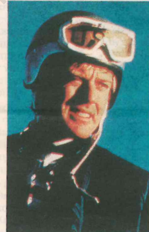
Ο Ρόμπερτ Ρέντφορντ υποδύθηκε έναν εγωιστή επαρχιώτη που γίνεται μέλος της αμερικανικής Ολυμπιακής ομάδας του σκι, στην ταινία «Downhill racer».

ρές στη μετά τον Α' Παγκόσμιο Πόλεμο Βρετανία, οι προκλήσεις στην πορεία τους, οι θυσίες και τα καταπεσμένα τους αισθήματα ακόμα και σε στιγμές αγαλλίασης.