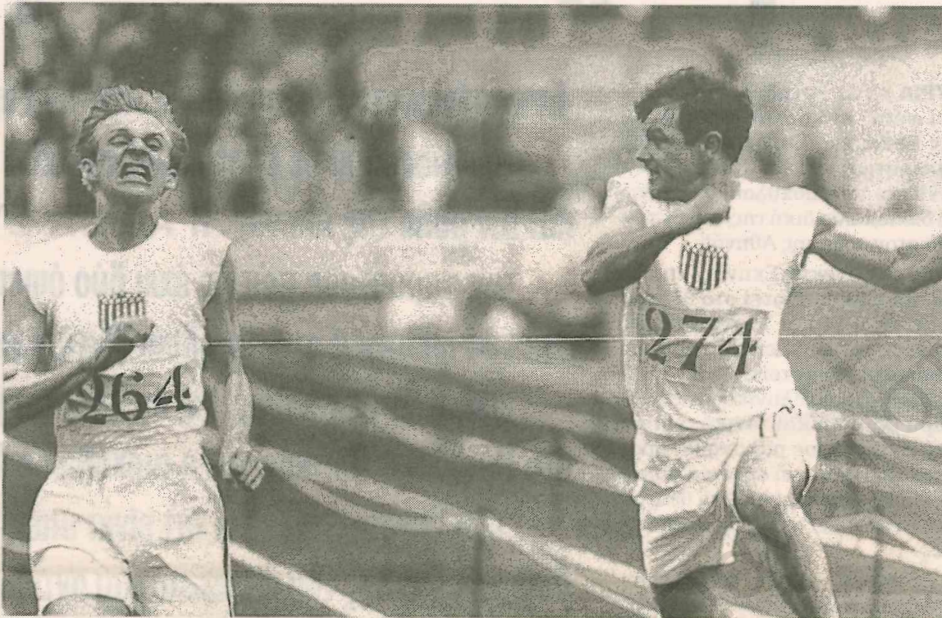
«Οι δρόμοι της φωτιάς», υποψήφιο για 7 Οσκαρ το 1981, κέρδισε 4, ανάμεσά τους αυτά της καλύτερης ταινίας και μουσικής για το αξέχαστο σάουντρακ του Βαγγέλη Παπαθανασίου, είναι η μοναδική ταινία με επίκεντρο τους Ολυμπιακούς Αγώνες που έχει κερδίσει τη μεγαλύτερη διεθνή αναγνώριση έως σήμερα.

ΝΤΟΚΙΜΑΝΤΕΡ και ΤΑΙΝΙΕΣ μυθοπλασίας ύμνησαν πραγματικούς άθλους διαγωνιζομένων φανερώνοντας την ομορφιά των Ολυμπιακών Αγώνων, όπως επίσης και πολλοί ΟΛΥΜΠΙΟΝΙΚΕΣ πέρασαν στον χώρο της σόουμπιζ επιβεβαιώνοντας τη στενή σχέση μεταξύ σπορ, θεάματος και... Χόλιγουντ ΡΕΠΟΡΤΑΖ από την Αντα Δαλιάρκα