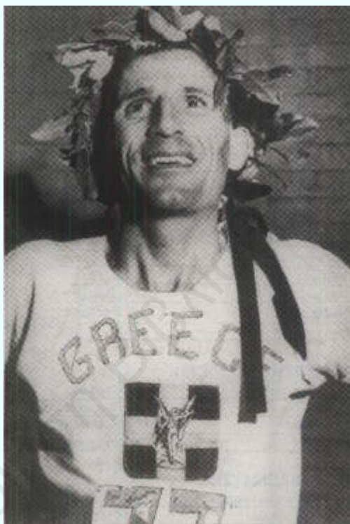
Με το δάφνινο στεφάνι της νίκης στη Βοστόνη.