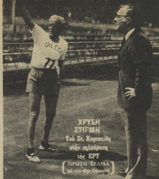
ΧΡΥΣΗ ΣΤΙΡΜΗ Το Στ. Κυριακίδη στην ιαλέοραση της ΕΡΤ [ΠΡΩΤΗ ΣΕΛΙΔΑ με τον Φρ. Γερμανό]