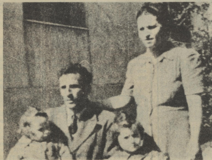
Ο Στέλιος Κυριακίδης με την οικογένειά του την εποχή της μεγάλης νίκης του...