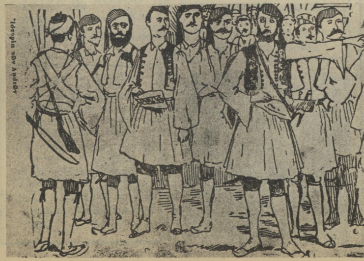
Η ληστεία στο Δήλεσι: Τό επόμενο θέμα της «Πρώτης Σελίδας».