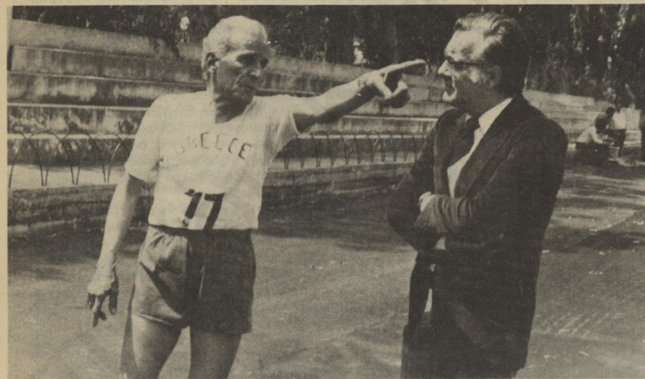
Ο Στέλιος Κυριακίδης ξαναζωντανεύει την «χρυσή» του στιγμή στον Φρέντου Γερμανό.