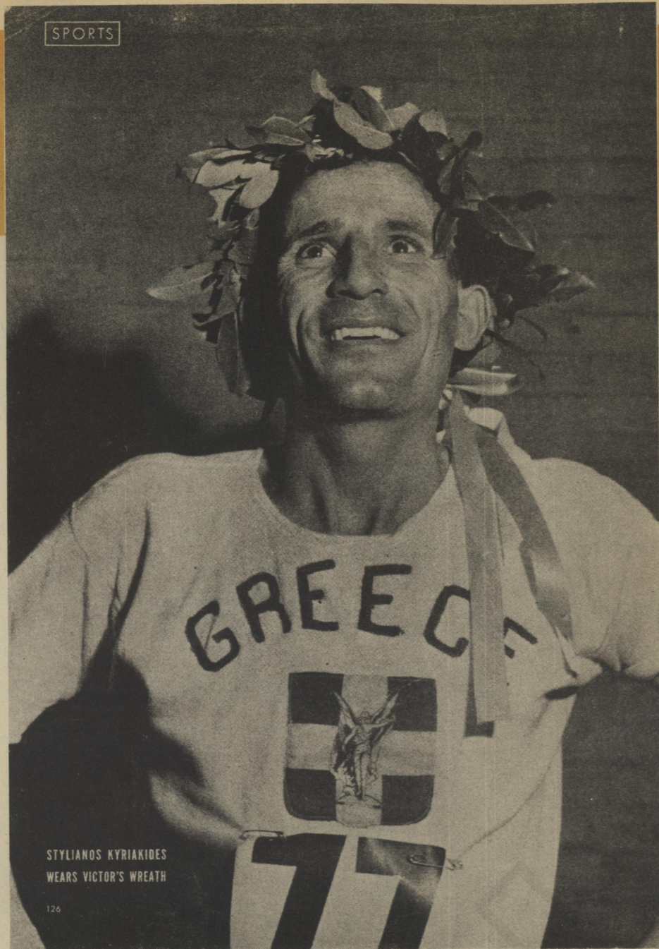
STYLIANOS KYRIAKIDES WEARS VICTOR'S WREATH

Μάης του '46. Ο Έλληνας νικητής του Μαραθωνίου στο περιοδικό «Λάιφ». Τίτλος: «Τό Έκανα για την πατρίδα μου».