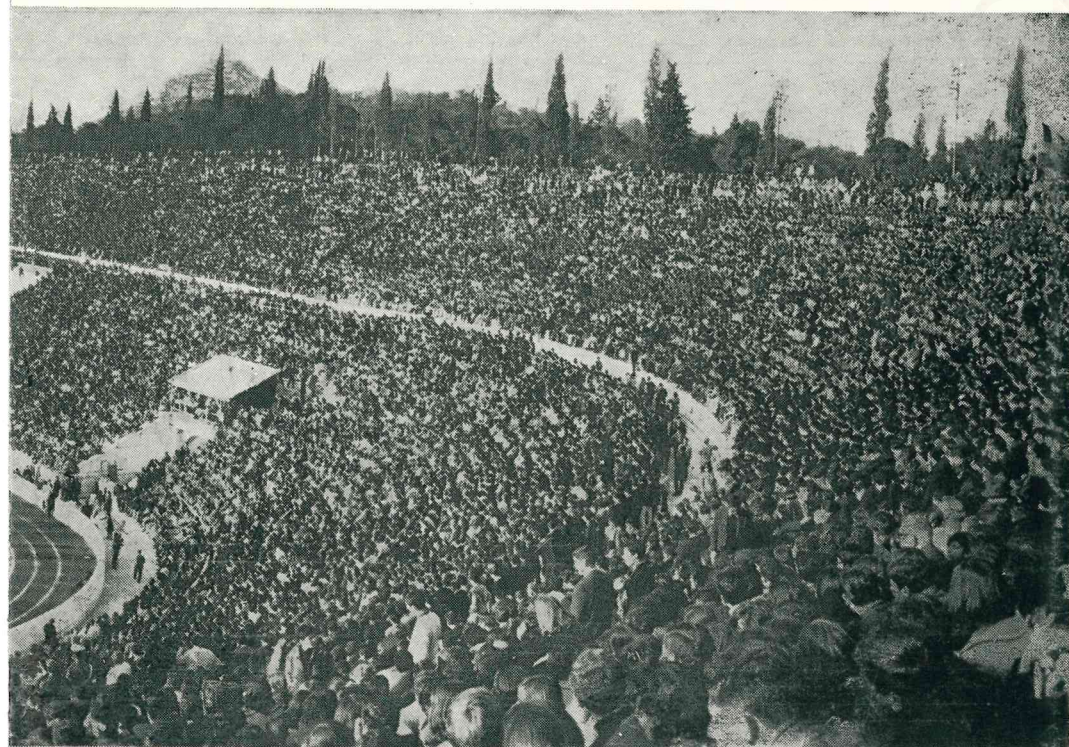
THE OLYMPIC STADIUM OF ATHENS (ΠΑΝΑΘΗΝΑΪΚΟΝ)

Spyros Louis, winner of the Marathon Race during [the Olympic Games held in the Athens, in 1896