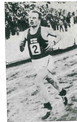
EINO OKSANEN (Finland) 1959

ΝΙΚΗΤΑΙ ΚΛΑΣΣΙΚΟΥ ΜΑΡΑΘΩΝΙΟΥ ΔΡΟΜΟΥ WINNERS OF THE CLASSICAL MARATHON RACES