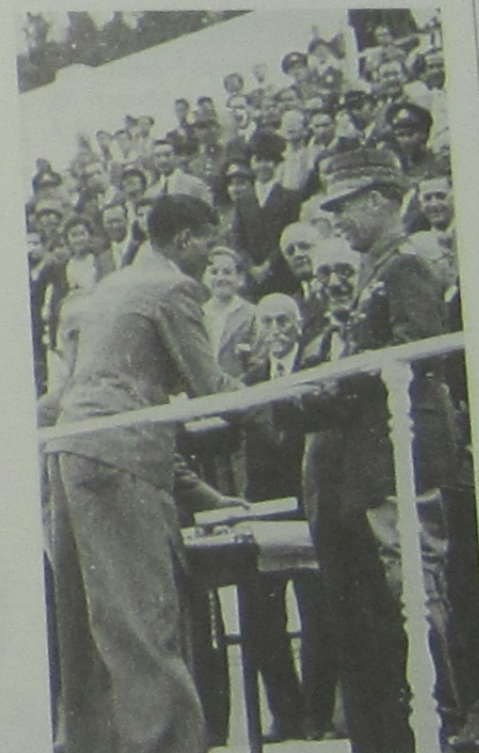
ΘΡΙΑΜΒΟΣ Στους Πανελλήνιους Αγώνες του 1936, παραλαμβάνει το έπαθλο από τον βασιλιά Γεώργιο.

Με τον Β' Παγκόσμιο Πόλεμο να διαλύει την Ελλάδα, αποφασίζει να συμμετάσχει στον Μαραθώνιο της Βοστώνης της 20ής Απριλίου 1946. Να βγει πρώτος, να μιλήσει για τη χώρα.