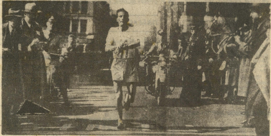
'Ανασκαλεύοντας τις παλιές φωτογραφίες του μεγάλου θριάμβου του, ο Στέλιος Κυριακίδης γέλασε. «Και με τέτοια σωβρακάνια μπορείς να διακριθείς σε μεγάλους αγώνες», είπε. Τώρα τους φταιει πού δέν έχουν... «άντιντας»!

Βοστώνη, 20.4.1946: Στο 27ο δευτερόλεπτο, μετά από 2 ώρες και 29 λεπτά εξαντλητικό τρέξιμο, τό στήθος του «άγνωστου», λεπτοκαμωμένου Έλληνα δρομέα Στέλιου Κυριακίδη άγγιξε κι' έκοψε τό νήμα του άνεπανάλη π τ ο υ θριάμβου.