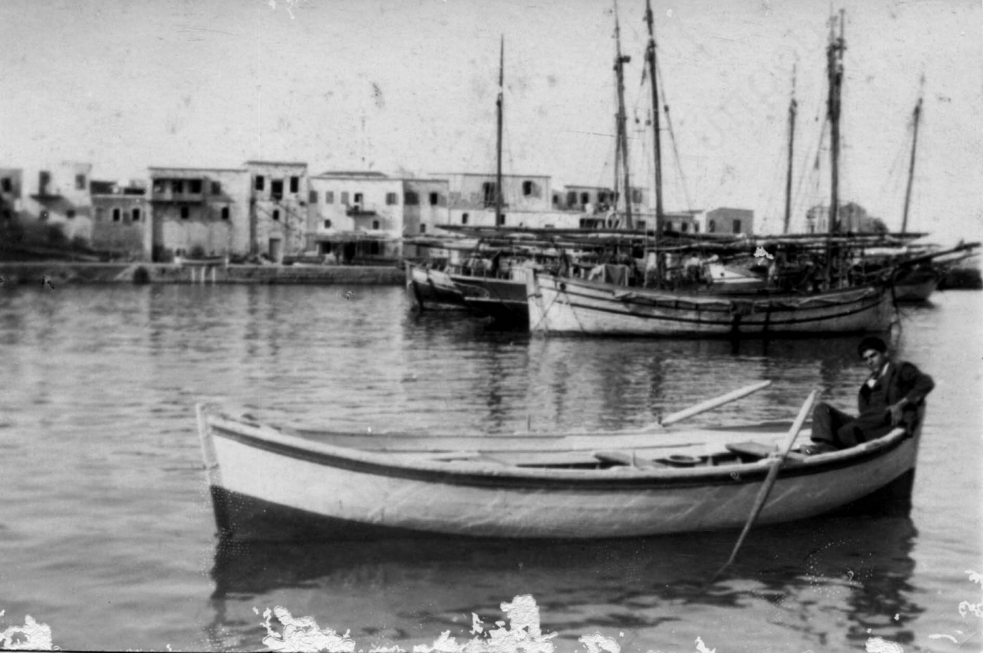
Λιμάνι Κερύνειας, δεκαετία 1920