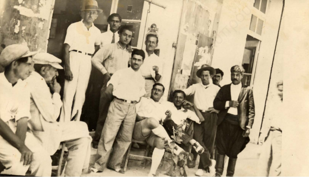
ΚΕΡΥΝΕΙΑ 27/6/1934 ΣΤΟ ΓΡΑΦΕΙΟ ΒΕΛΟΣ