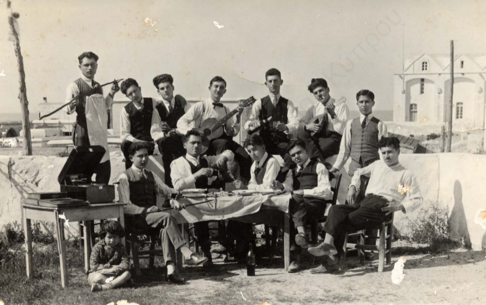
Γλέντι στην Κερύνεια γύρω στο 1930