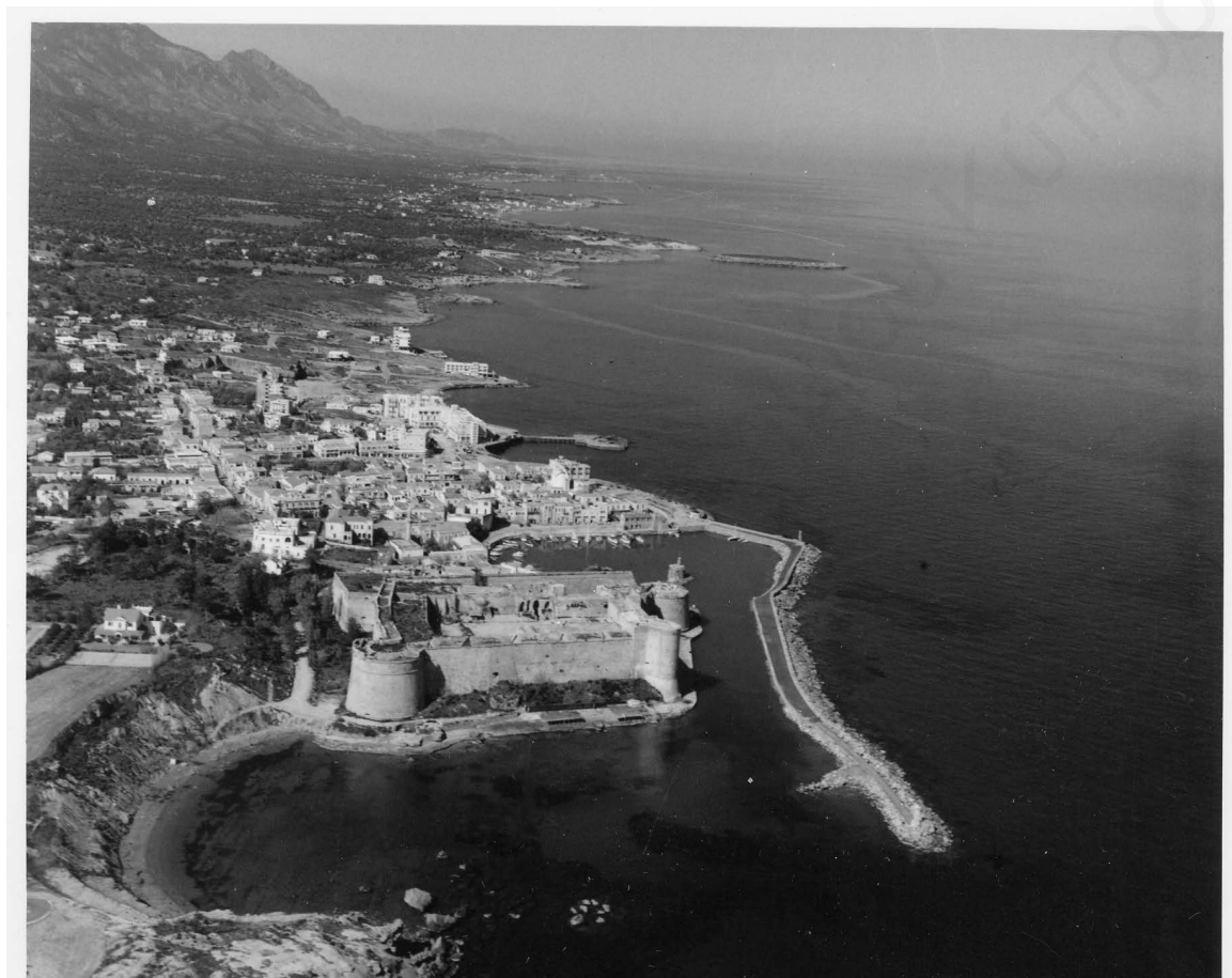
Αεροφωτογραφία της Κερύνειας, με το λιμάνι της όπως ήταν διαμορφωμένο τη δεκαετία του 1960. (Αρχείο Γραφείου Τύπου και Πληροφοριών ).