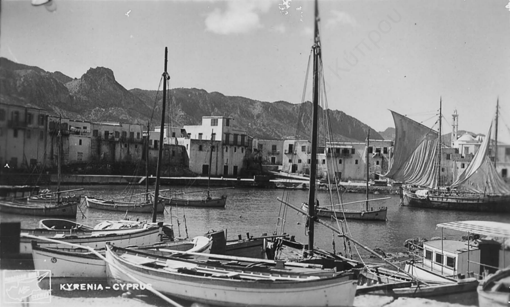
KYRENIA - CYPRUS