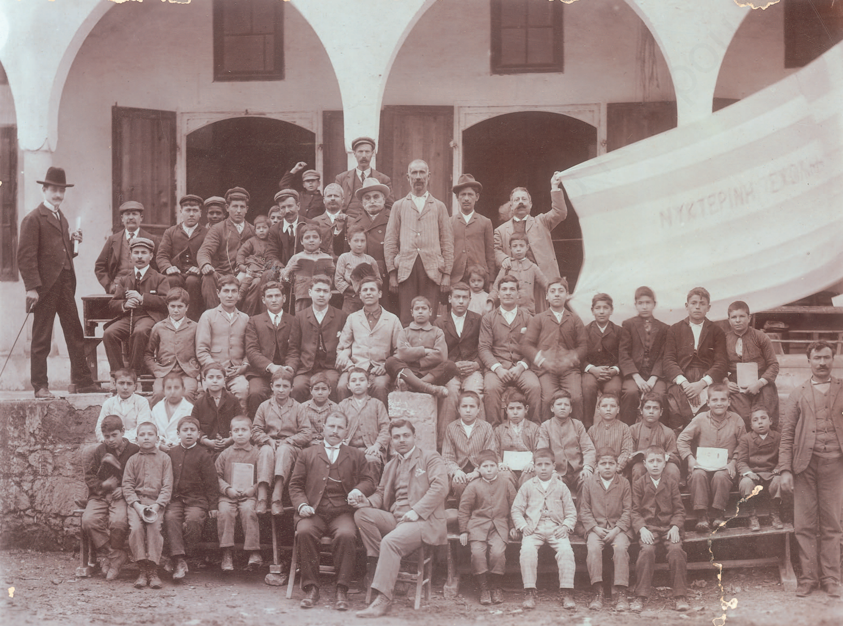
6. Μικροί μαθητές και φοιτητές της Νυκτερινής σχολής με το λάβαρό τους στο οποίο αναγράφονται οι λέξεις «ΝΥΧΤΕΡΙΝΗ ΣΧΟΛΗ», αρχές του 20ου αιώνα. (αρχείο Γιώργου Καραγιάννη).