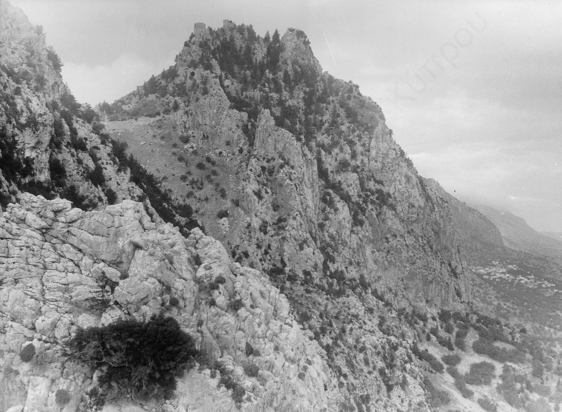
7. Η κορυφή με το κάστρο του Αγίου Ιλαρίωνα (ο Άης Λαρκός) και κάτω δεξιά στην πλαγια του βουνου το χωριο Κάρμι. (αρχείο προσφυγικού σωματείου «Κάρμι-Τριμύθι»).