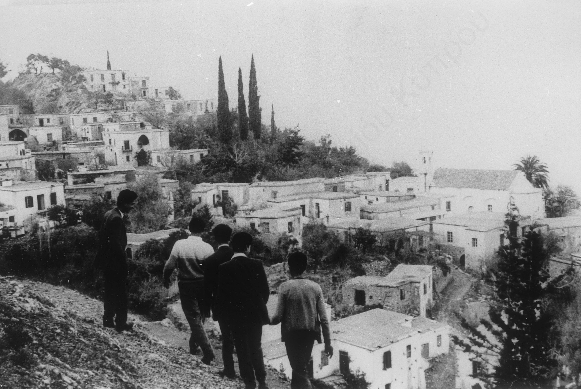
8. Μέρος του χωριού Κάρμι πριν την εισβολή με την εκκλησία της Παναγίας της Καρμιώτισσας δεξιά. (Αρχείο προσφυγικού σωματείου «Κάρμι-Τριμύθι»).