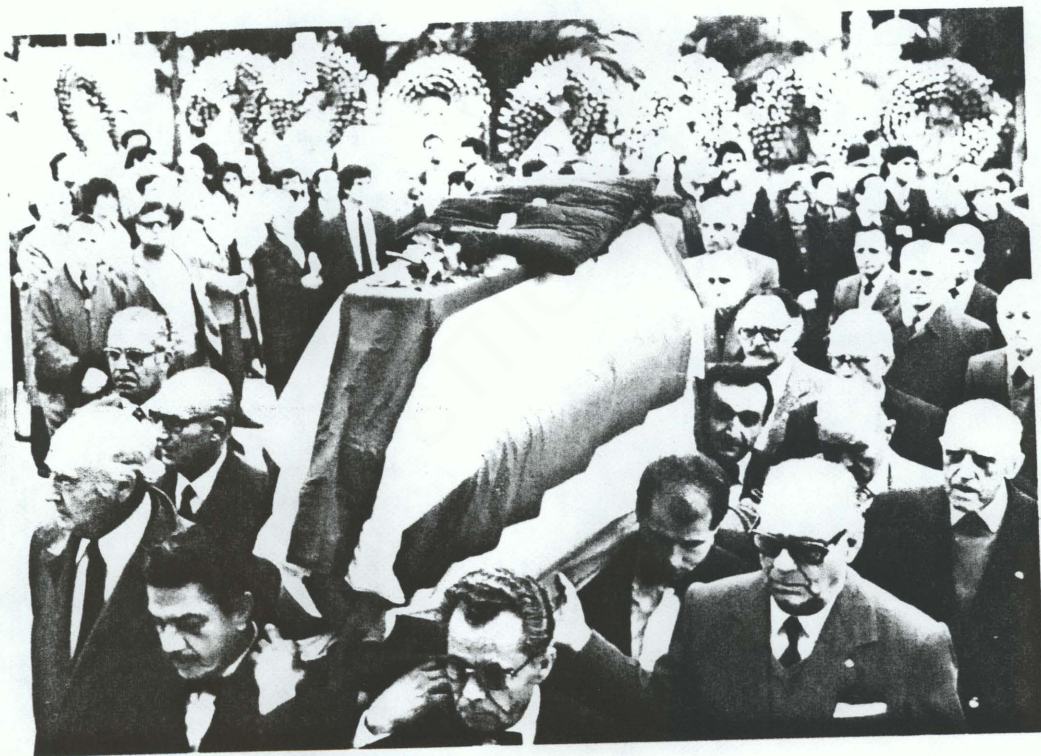
Ο Στέλιος Κυριακίδης σκεπασμένος με την ελληνική σημαία οδεύει προς την τελευταία του κατοικία. Τον ακολουθούν οι συναθλητές τους.