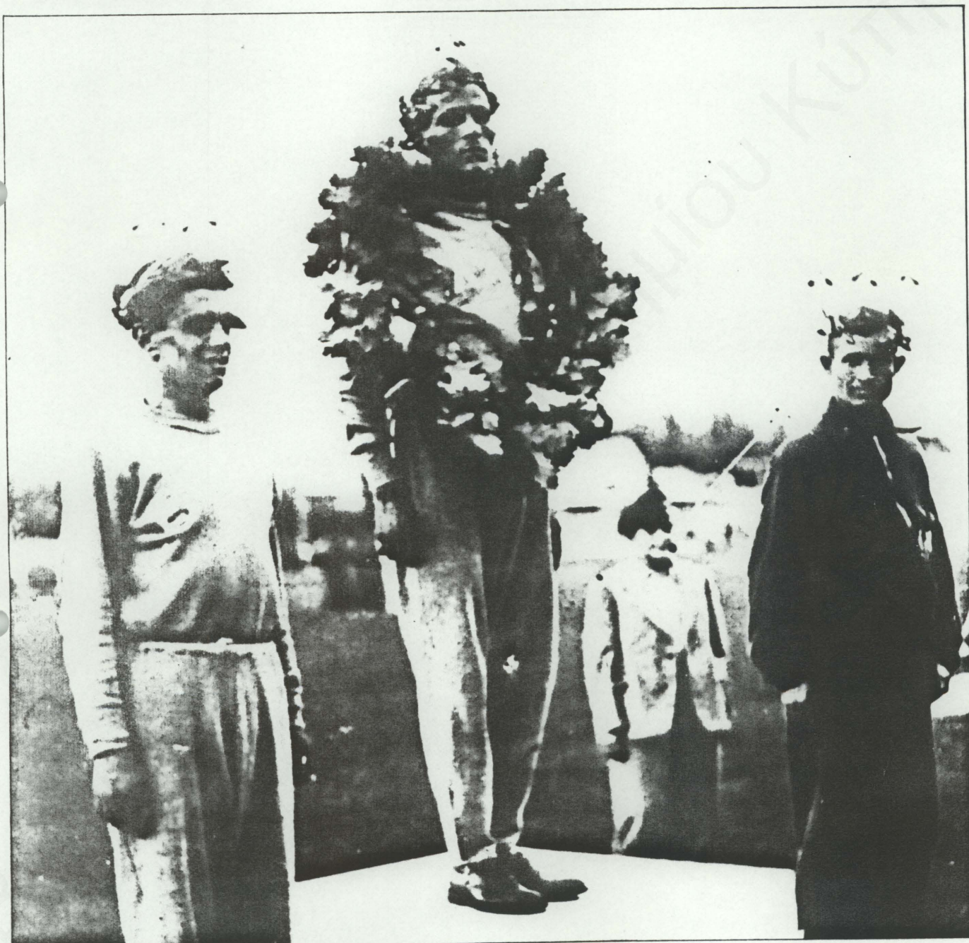
Βαλκανιάδα 1937 - Στο μέσον Στ. Κυριακίδης

Δέος σε τυλίγει όταν σκέφτεσε να γράψεις κάτι για ένα τόσο δοξασμένο πρωταθλητή. Γνωρίζεις ότι τίποτα δεν έχει μείνει άγραφο και δεν είναι