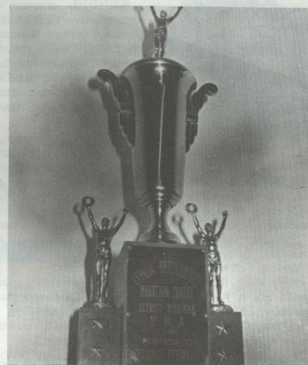
Το τρόπαιο για τη θριαμβευτική νίκη του Στέλιου Κυριακίδη στο Μαραθώνιο της Βοστώνης, το 1946.