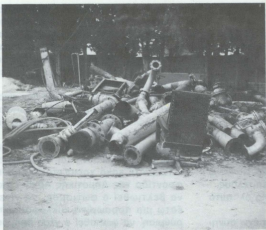
Εκατομμύρια στα σκουπίδια... από το αντλιοστάσιο της Φιλοθέης, μηχανήματα πολλών εκατομμυρίων για πέταμα;