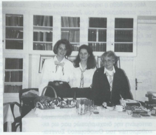
Από την ετήσια Χριστουγεννιάτικη εορταγορά των Οδηγών Φιλοθέης που είχε και φέτος όπως κάθε χρόνο πολύ μεγάλη επιτυχία.