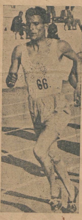
Ο ΣΤΕΛΙΟΣ ΚΥΡΙΑΚΙΔΗΣ πρωταθλητής του κόσμου.

ΟΛΟΚΛΗΡΟΣ Η ΒΟΣΤΩΝΗ ΠΛΕΕΙ ΕΙΣ ΤΟ ΓΑΛΑΝΟΛΕΥΚΟΝ, ΠΑΝΗΓΥΡΙΖΟΥΣΑ ΜΕ ΕΞΑΛΟΝ ΕΝΘΟΥΣΙΑΣΜΟΝ ΔΙΑ ΤΟΝ ΥΠΕΡΟΧΟΝ ΕΛΛΗΝΙΚΟΝ ΑΘΛΟΝ