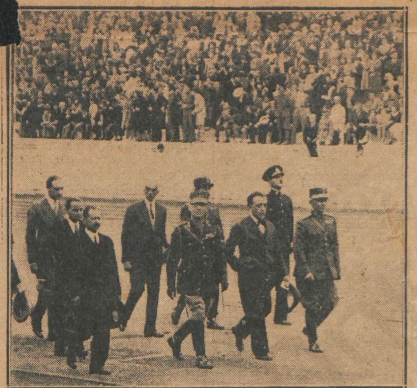
Ἡ Α. Μ. ὁ Βασιλεὺς εἰσερχόμενος χθὲς, τελευταίαν ἡμέραν τῶν ἀγῶνων, εἰς τὸ Στάδιον

Ἡ «Ἀθλητικὴ Νεολαία» δεῖται τὴν ὑπαρξίν της εἰς τὴν ὑπηρεσίαν ἔλων, οἱ ὅποιοι θέλουν νὰ ἐργασθῶν διὰ τὴν ἐπιτυχίαν τῆς ἡμέρας αὐτῆς προσπάθειας.