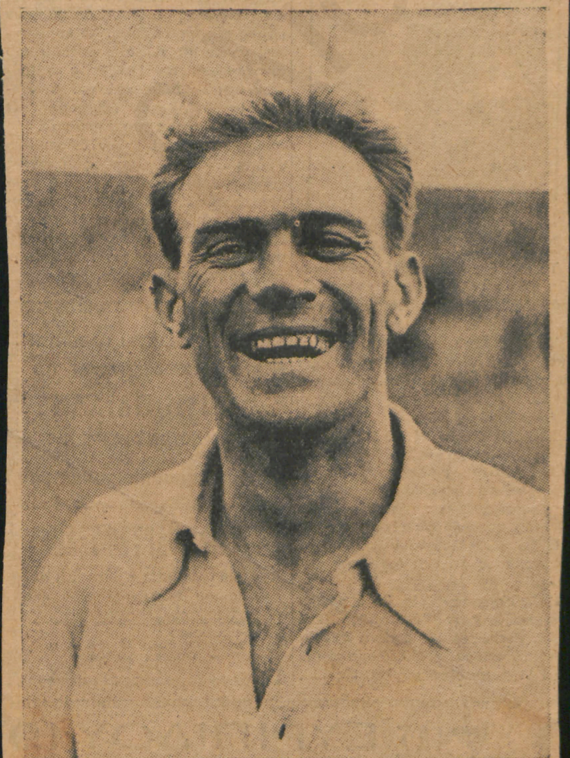
Ὁ θρυλικὸς Μάντικας, τὸ Ἴνδαλμα τῶν φιλάθλων τοῦ τόπου μᾶς